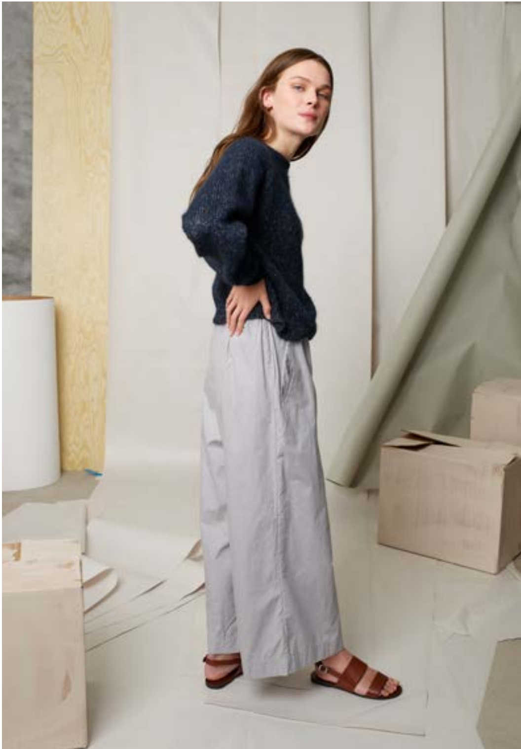
298-2 Fort gjort raglangenser i Alpakka Lin