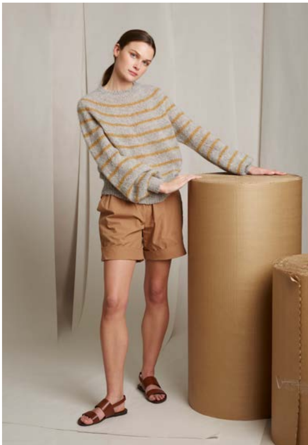
298-3 Lindas stripegenser i Alpukka Lin

Se forhandlerliste på www.raumagarn.no Del arbeidet ditt på Instagram #raumagarn