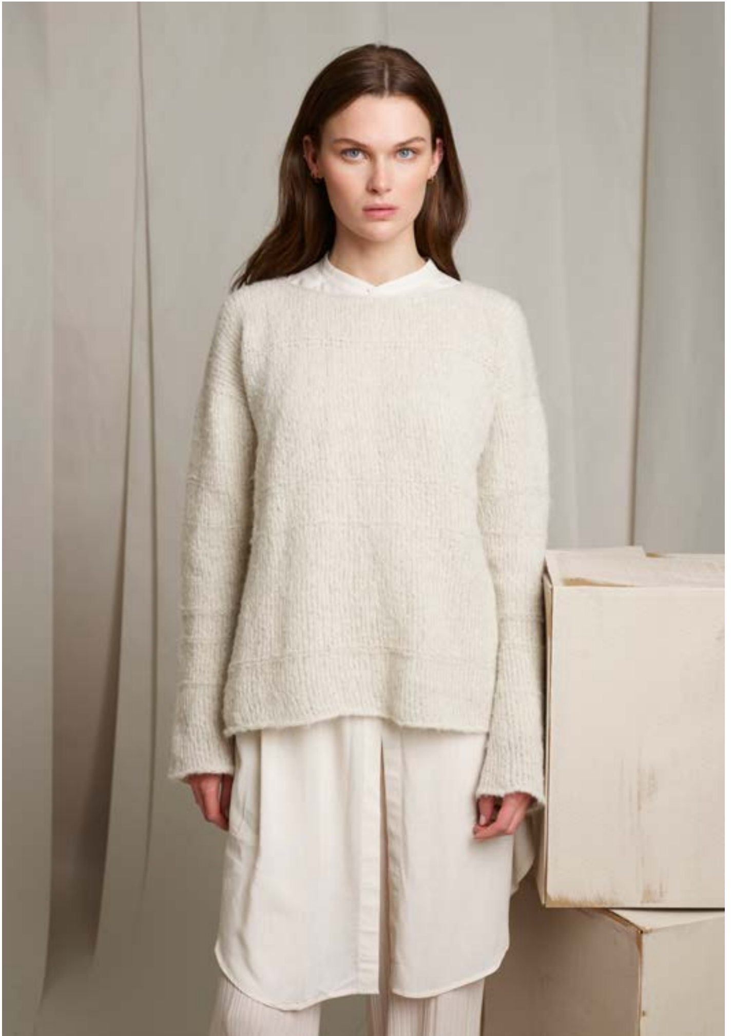
298-8 Lun sommergenser i Alpakka Lin