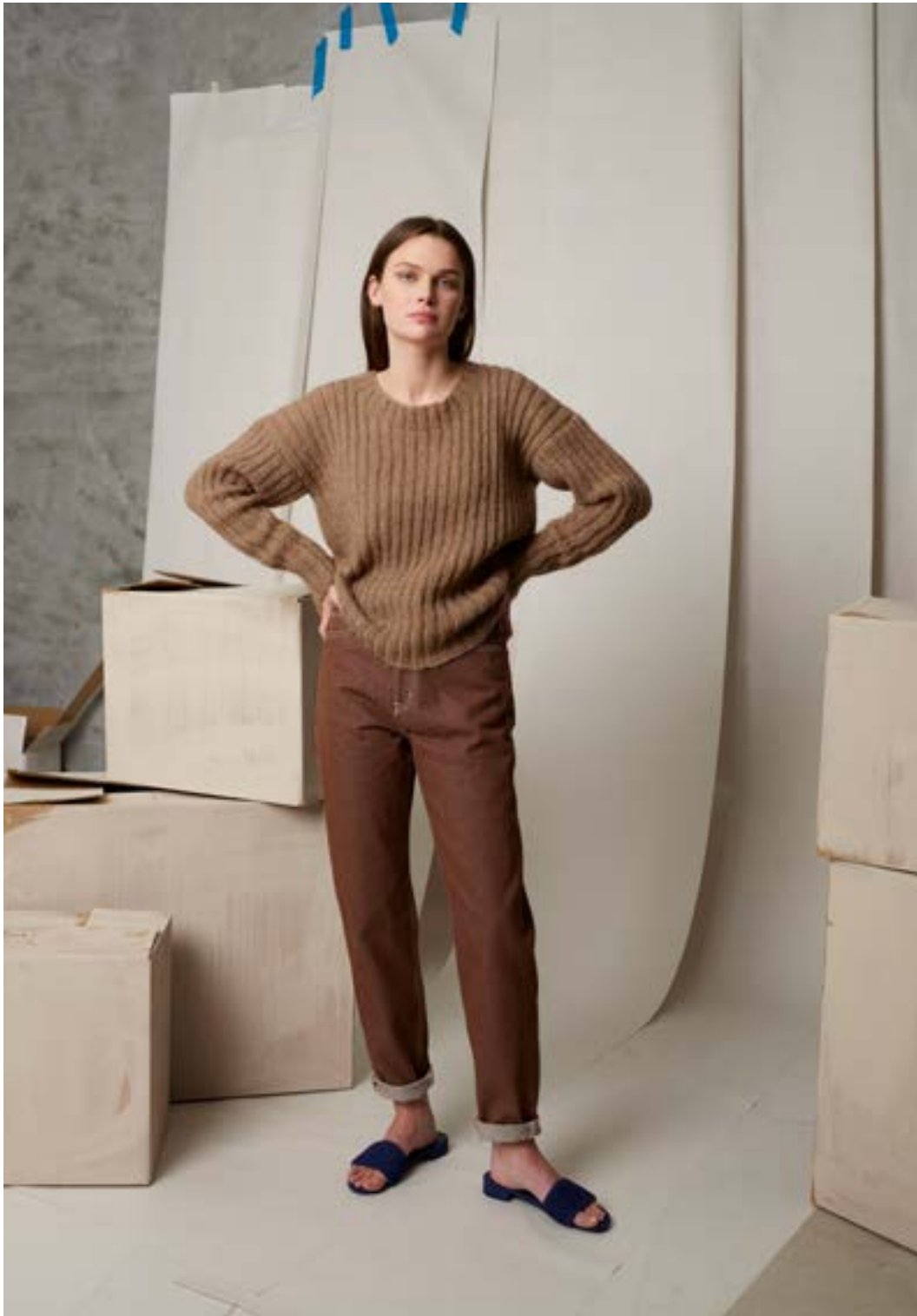
298-1 Ribbestrikket genser i Alpaka Lin