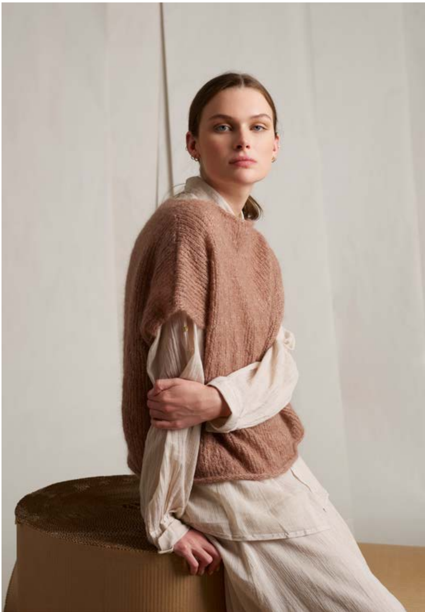
298-5 Trine-topp i Alpakka Lin