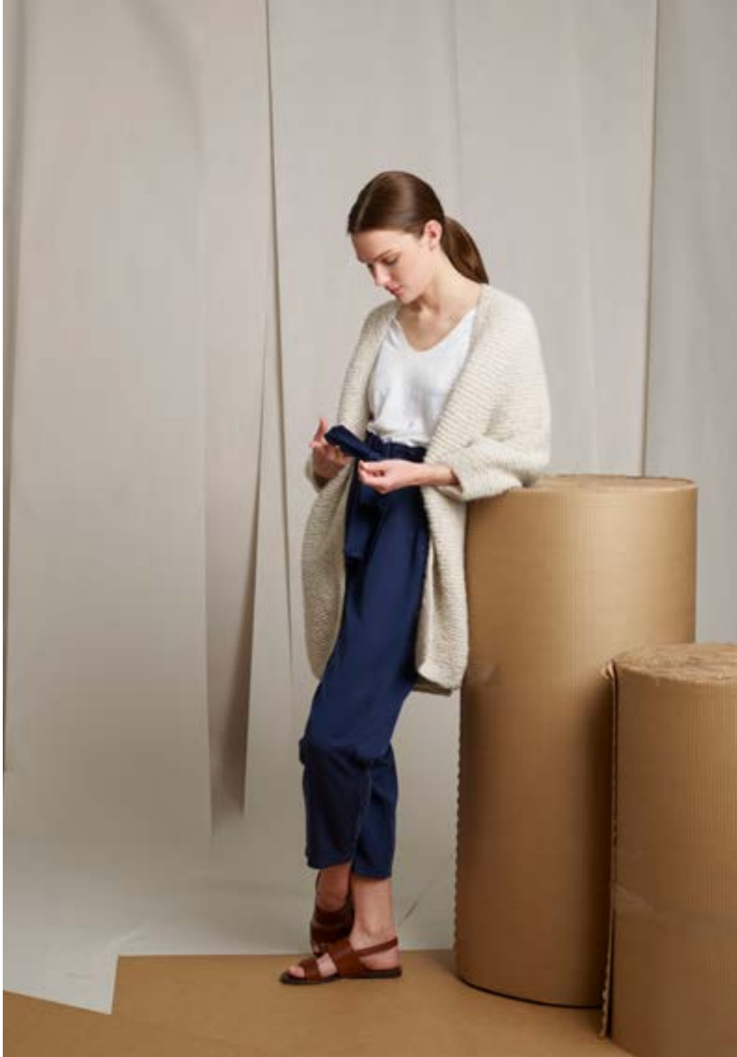
298-9 Rillejakke i Alpakka Lin