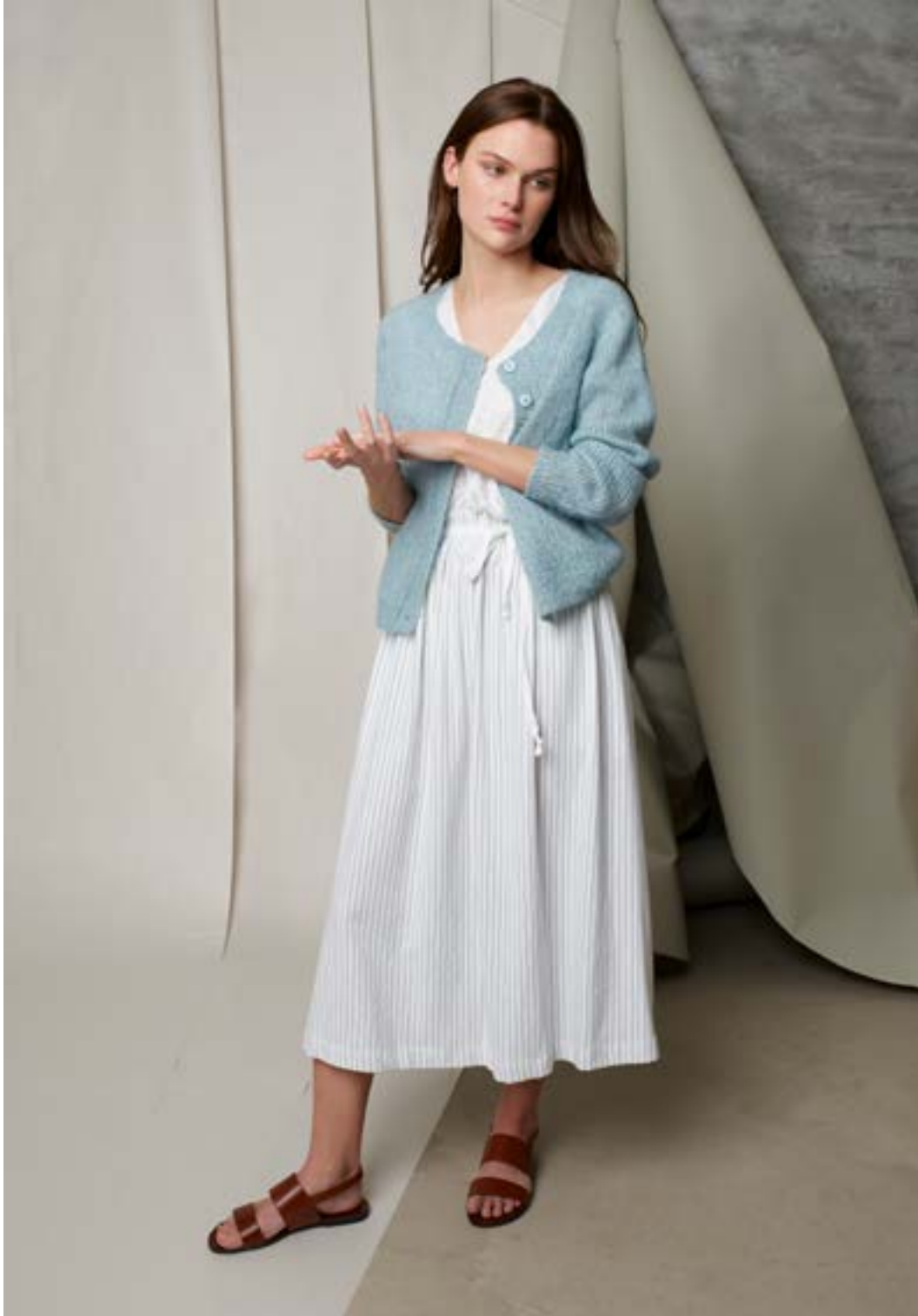
298-6 Ritas cardigan i Alpaka Lin