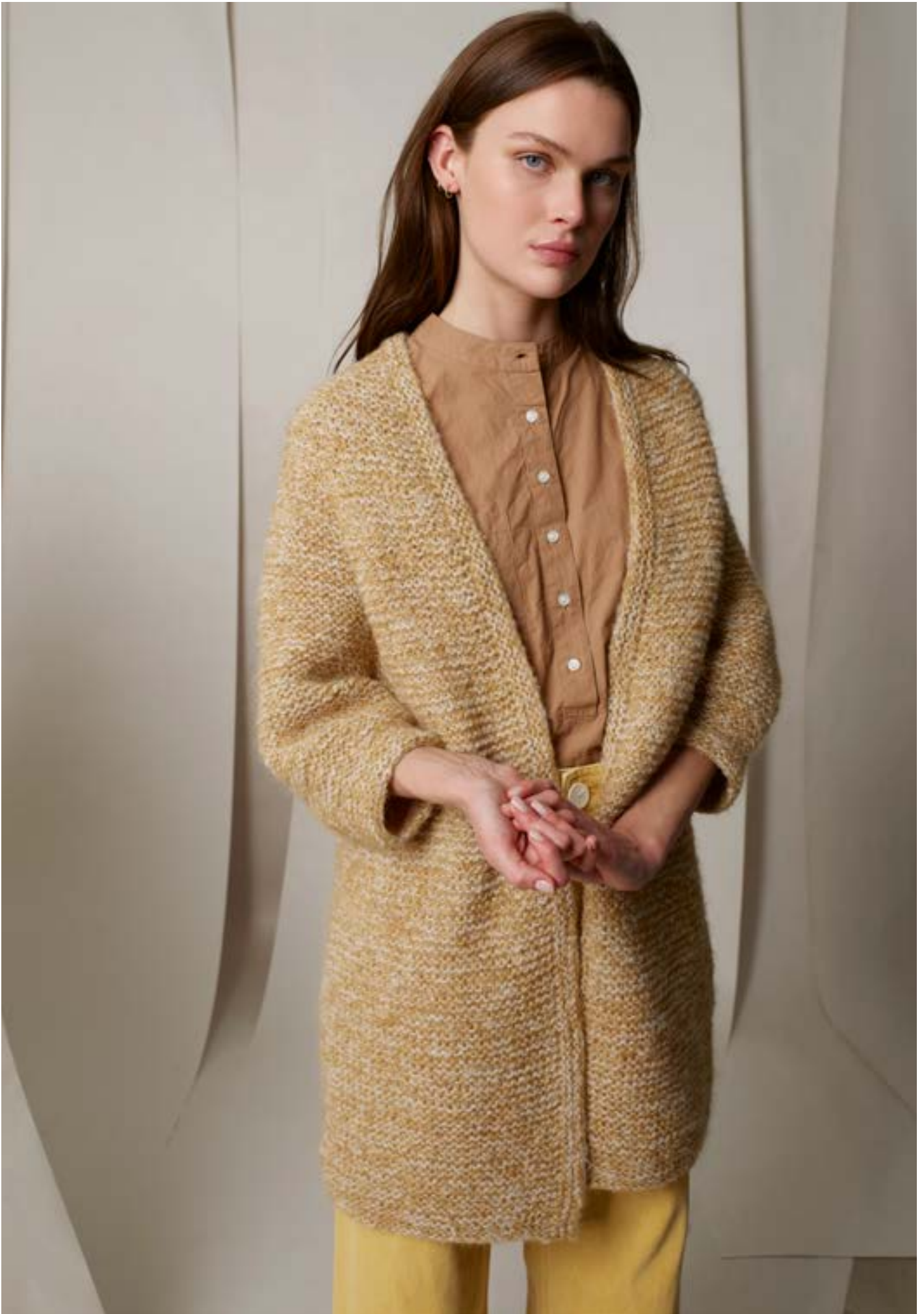
298-9 Rillejakke i Alpakka Lin