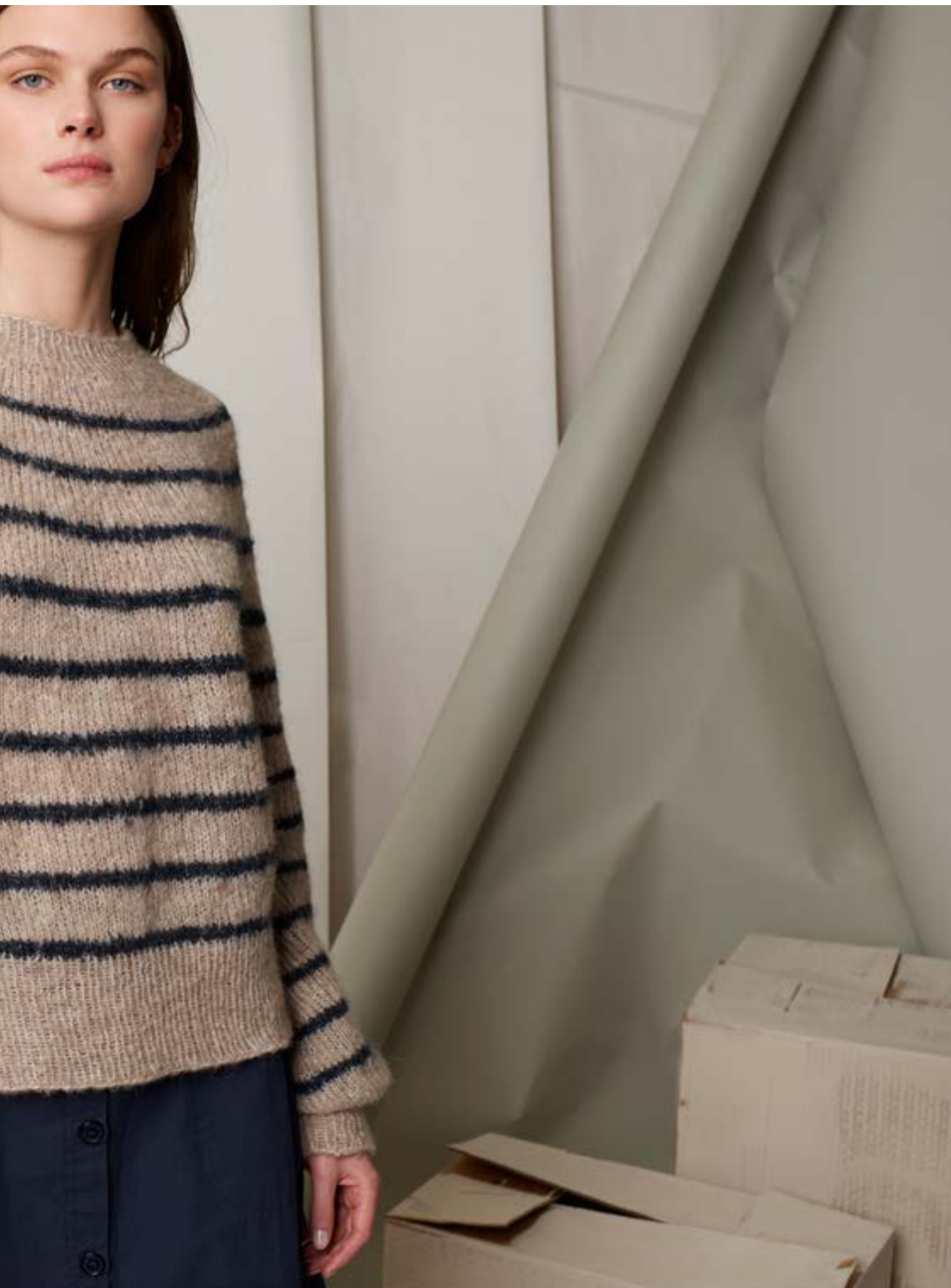
298-3 Lindas stripegenser i Alpakka Lin