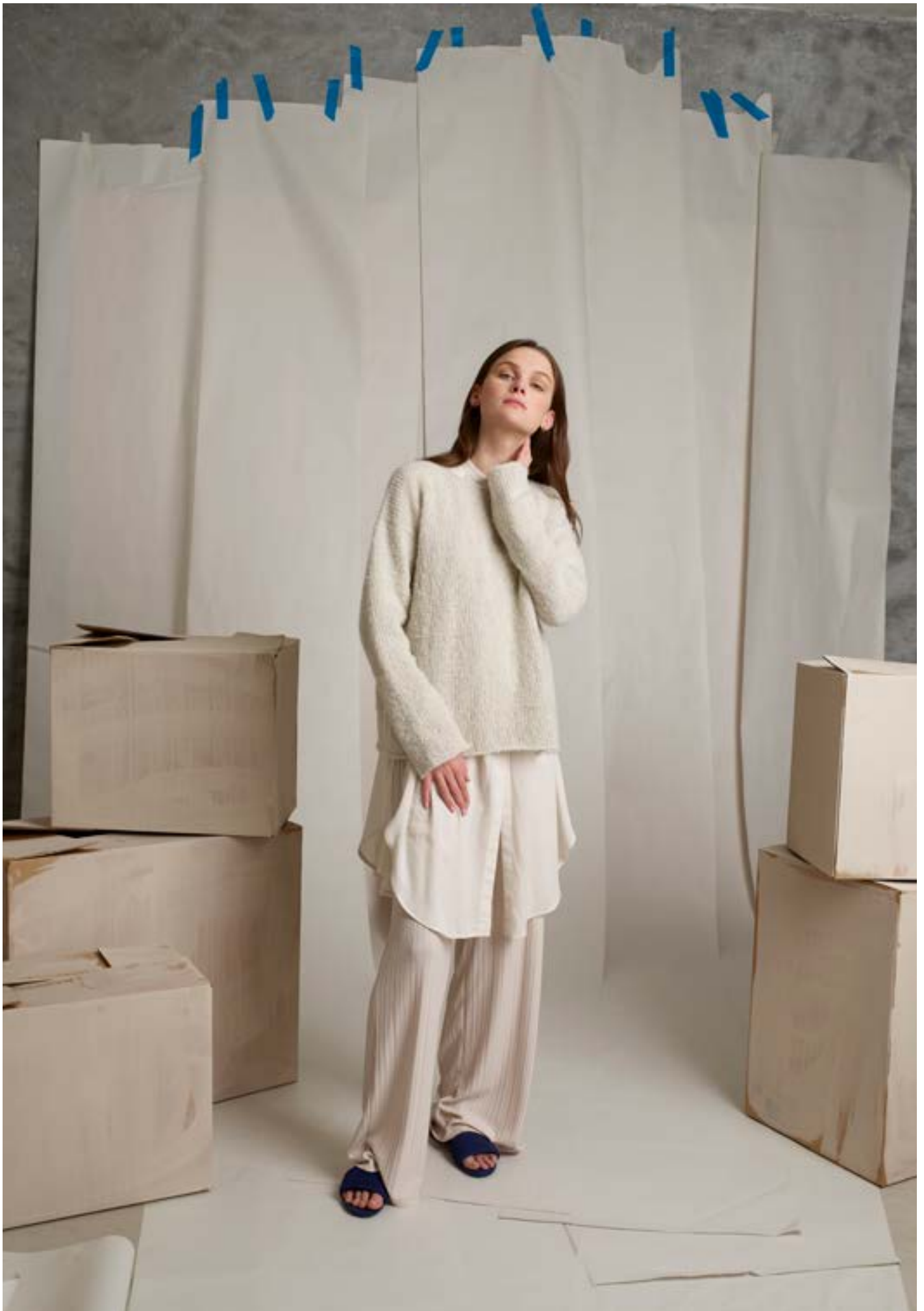
298-8 Lun sommgerser i Alpakka Lin