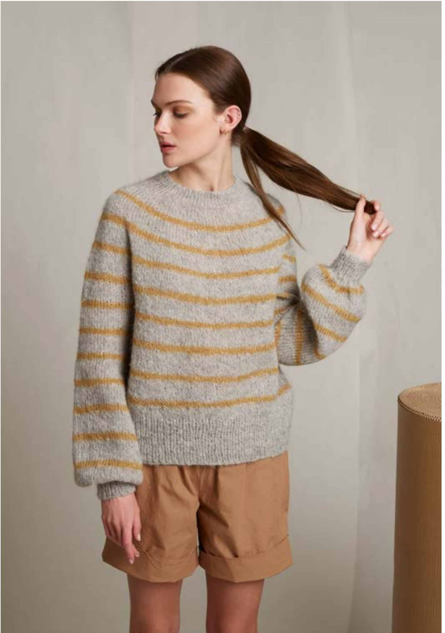
298-3 Lindas stripegenser i Alpakka Lin