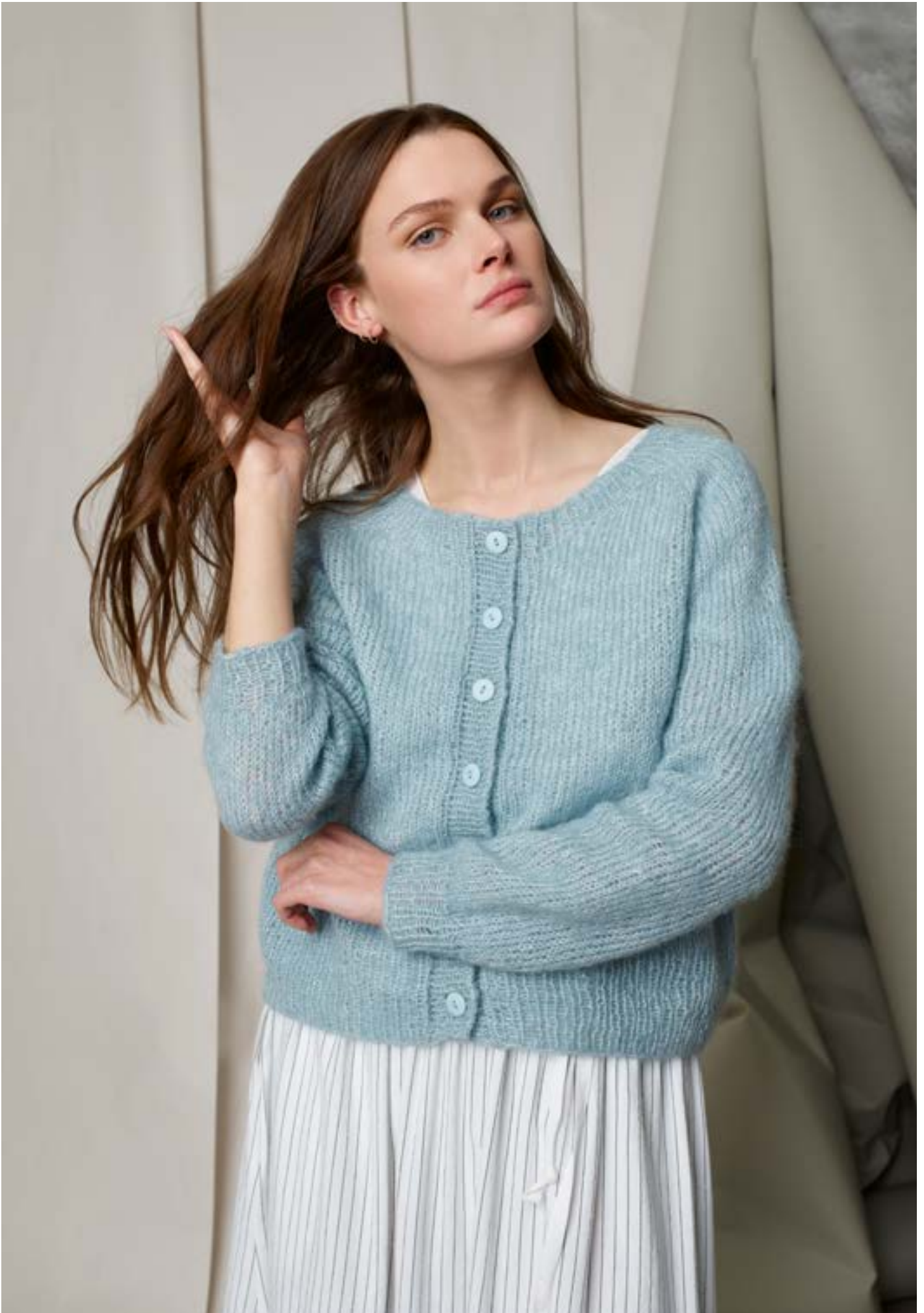
298-6 Ritas cardigan i Alpaka Lin