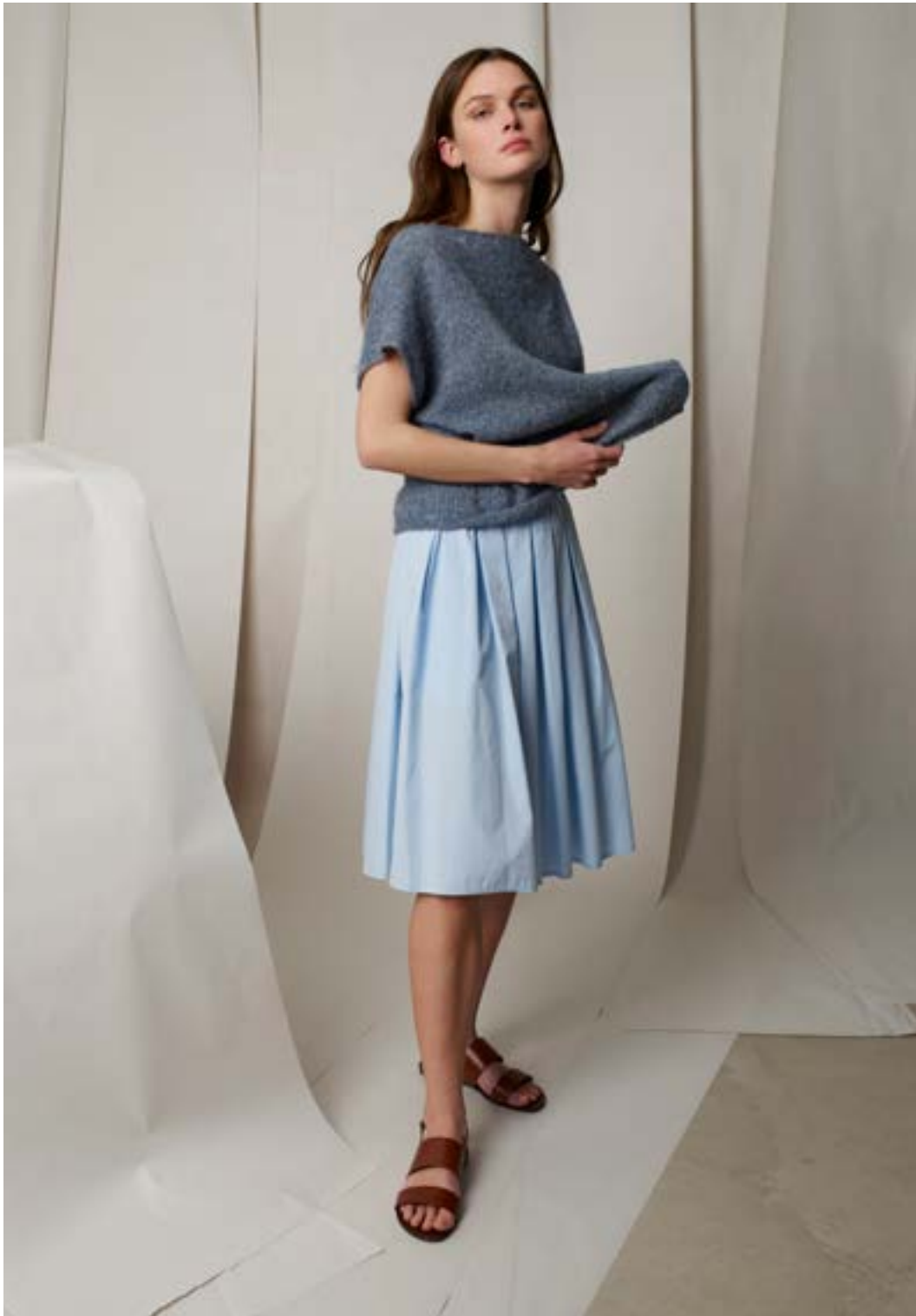
298-5 Trine-topp i Alpakka Lin