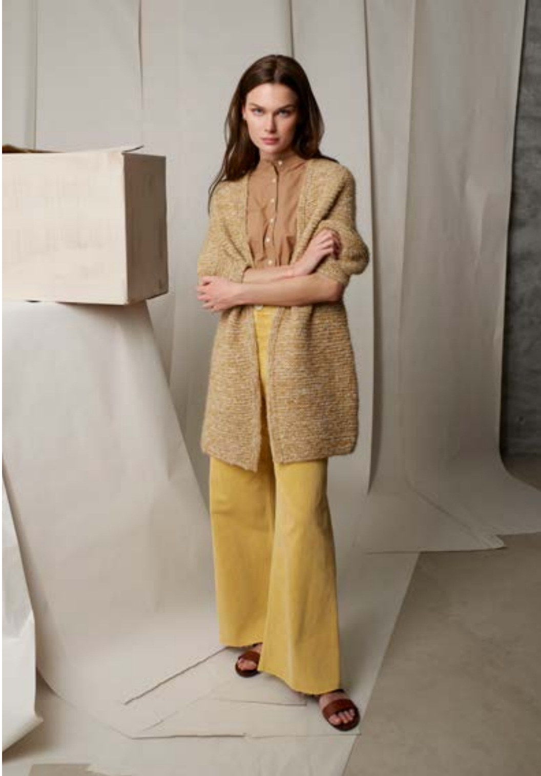
298-9 Rillejakke i Alpakka Lin