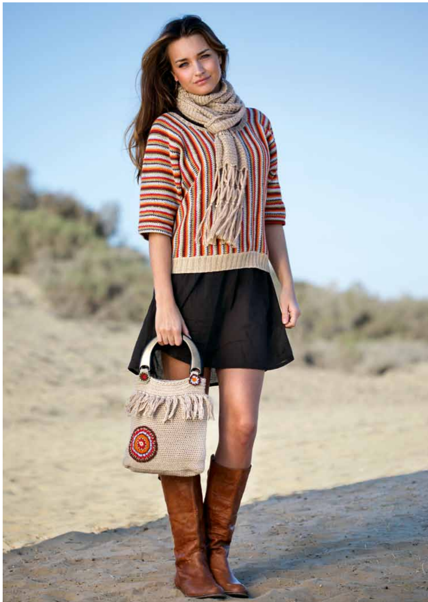
112-1752 Genser i Pt Pandora, XS-XXL. Skjurf i Pt Pandora og Plum. Veske i Pt Sumatra og Pt Pandora (til hekleblomster).