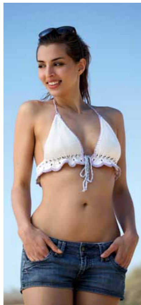
112-1747 Shorts (øverst) og bikinitopp i Pt Petunia, XS-XXL