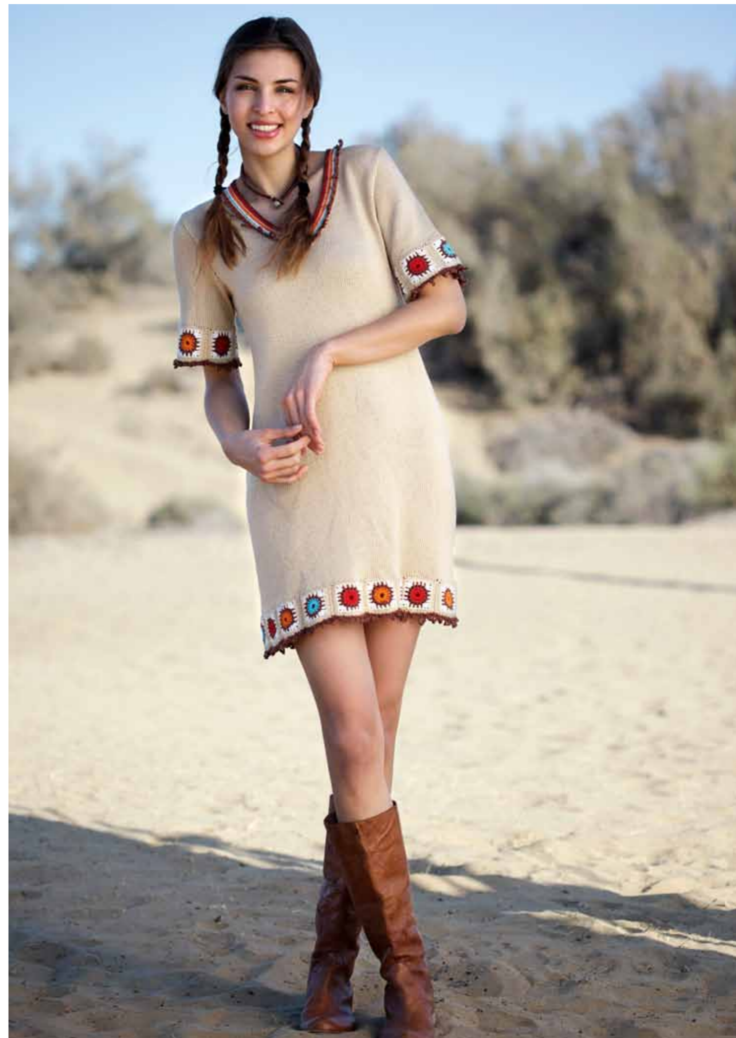
112-1746 Kjole i Pt Pandora, XS-XXL