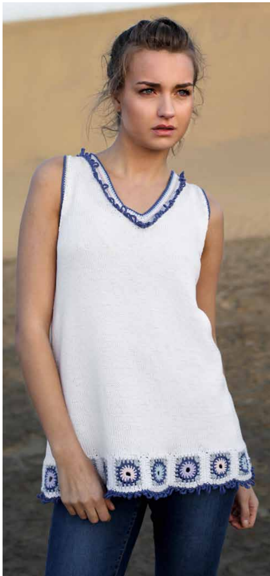
112-1746 Topp i Pt Pandora, XS-XXL