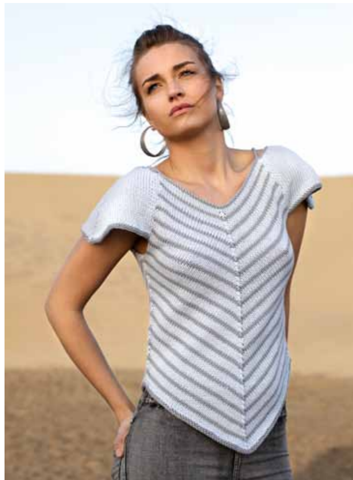
112-1758 Topp i Pt Pandora, XS-XL