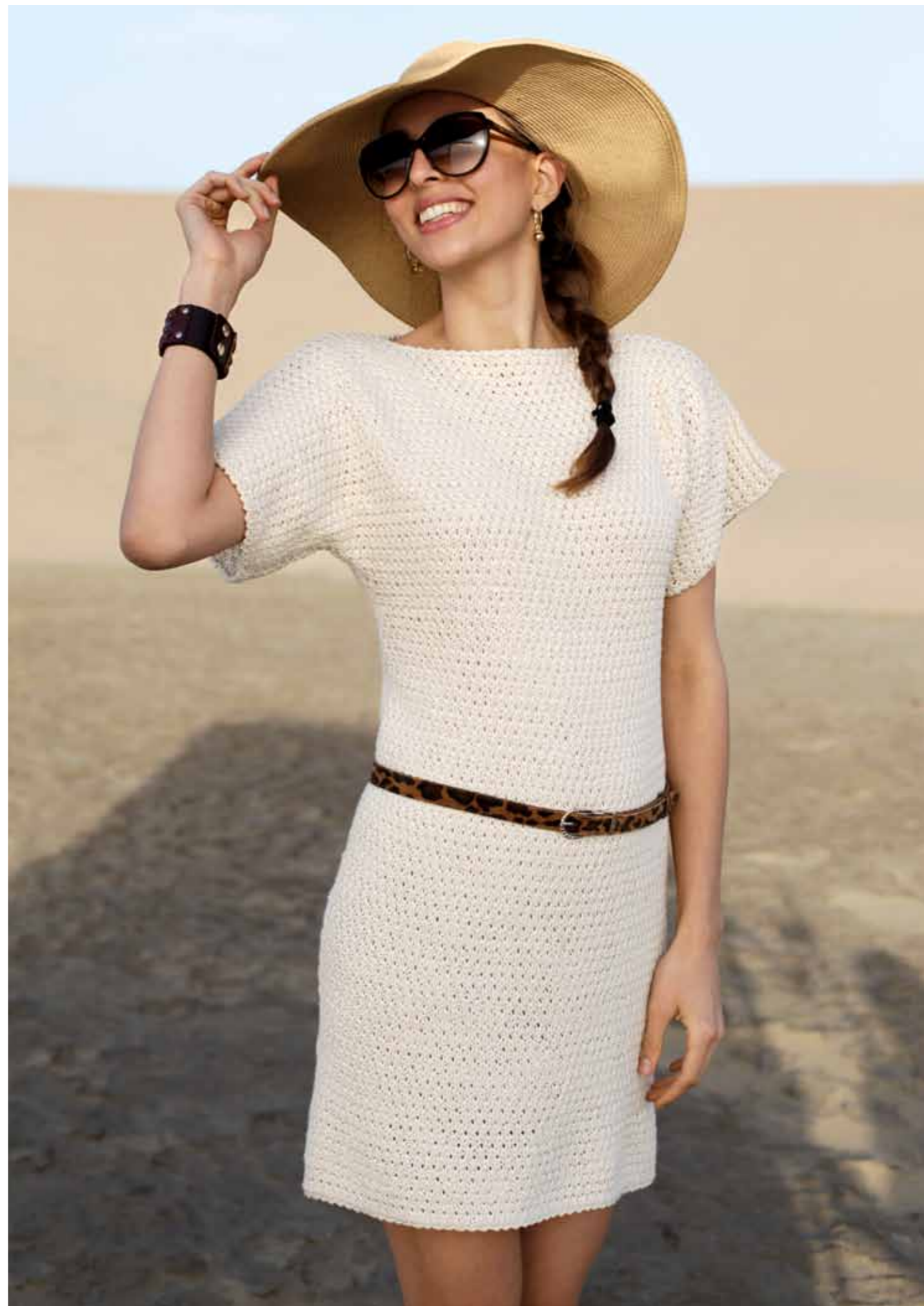
112-1750 Tunika i Pt Petunia, XS-XXL