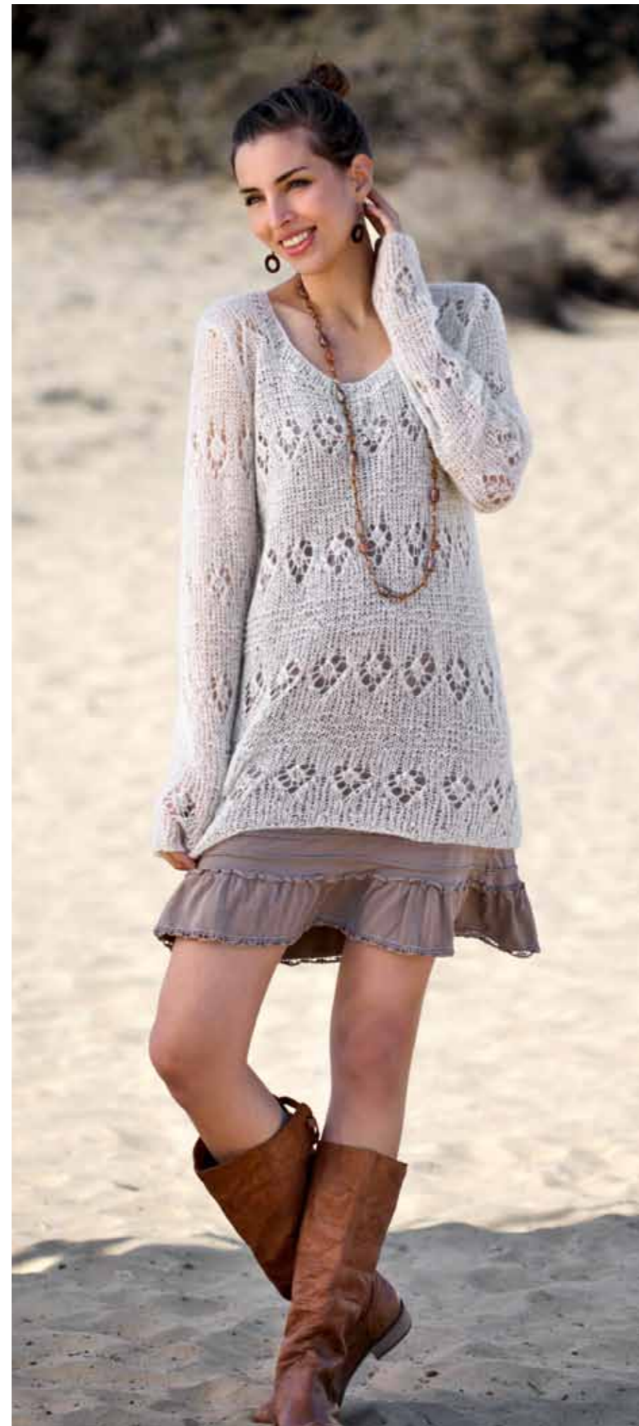
112-1760 Genser i Alpaca Silk og Metallic, S-XXXL