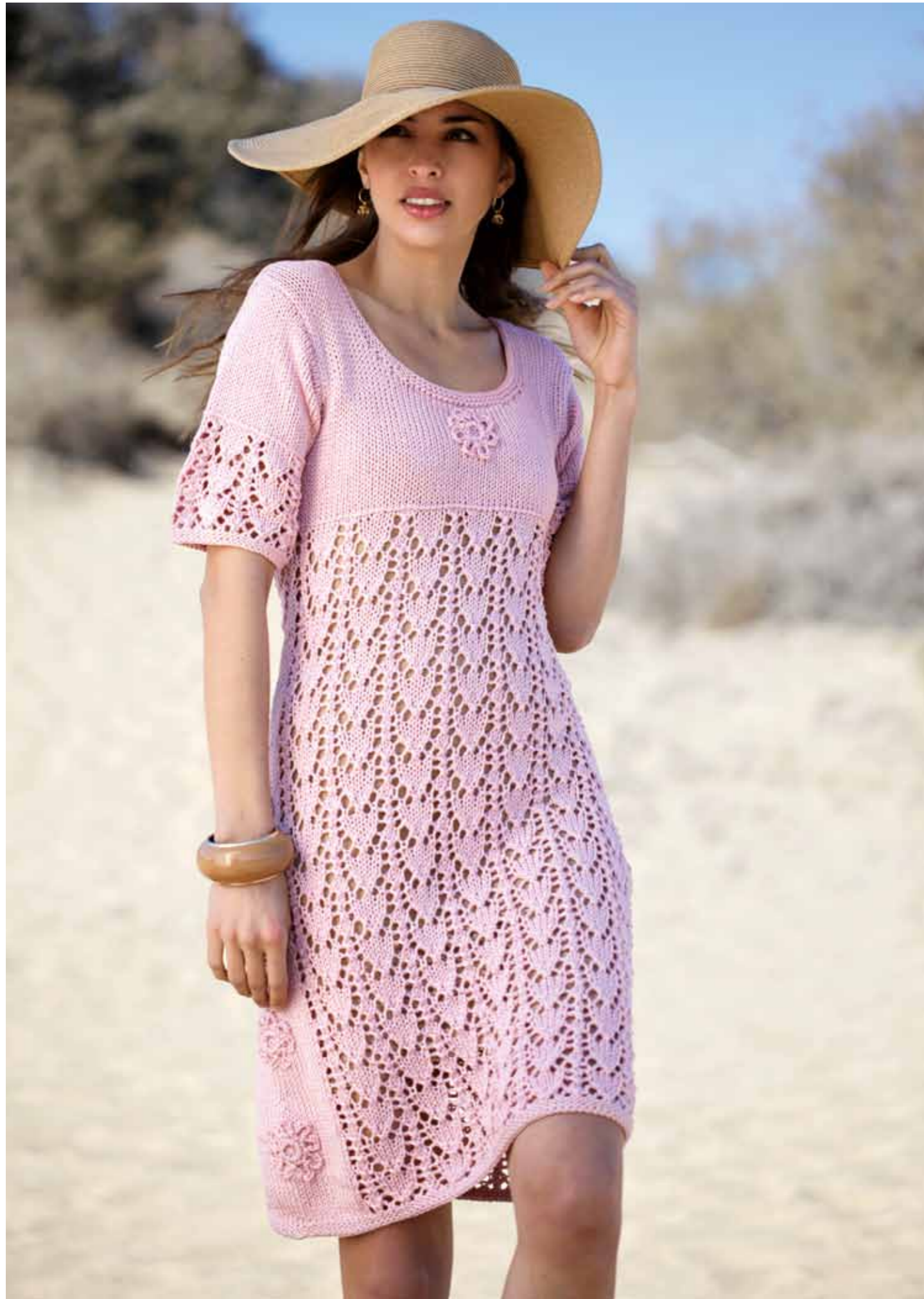
112-1749 Kjole i Pt Sumatra, XS-XXL