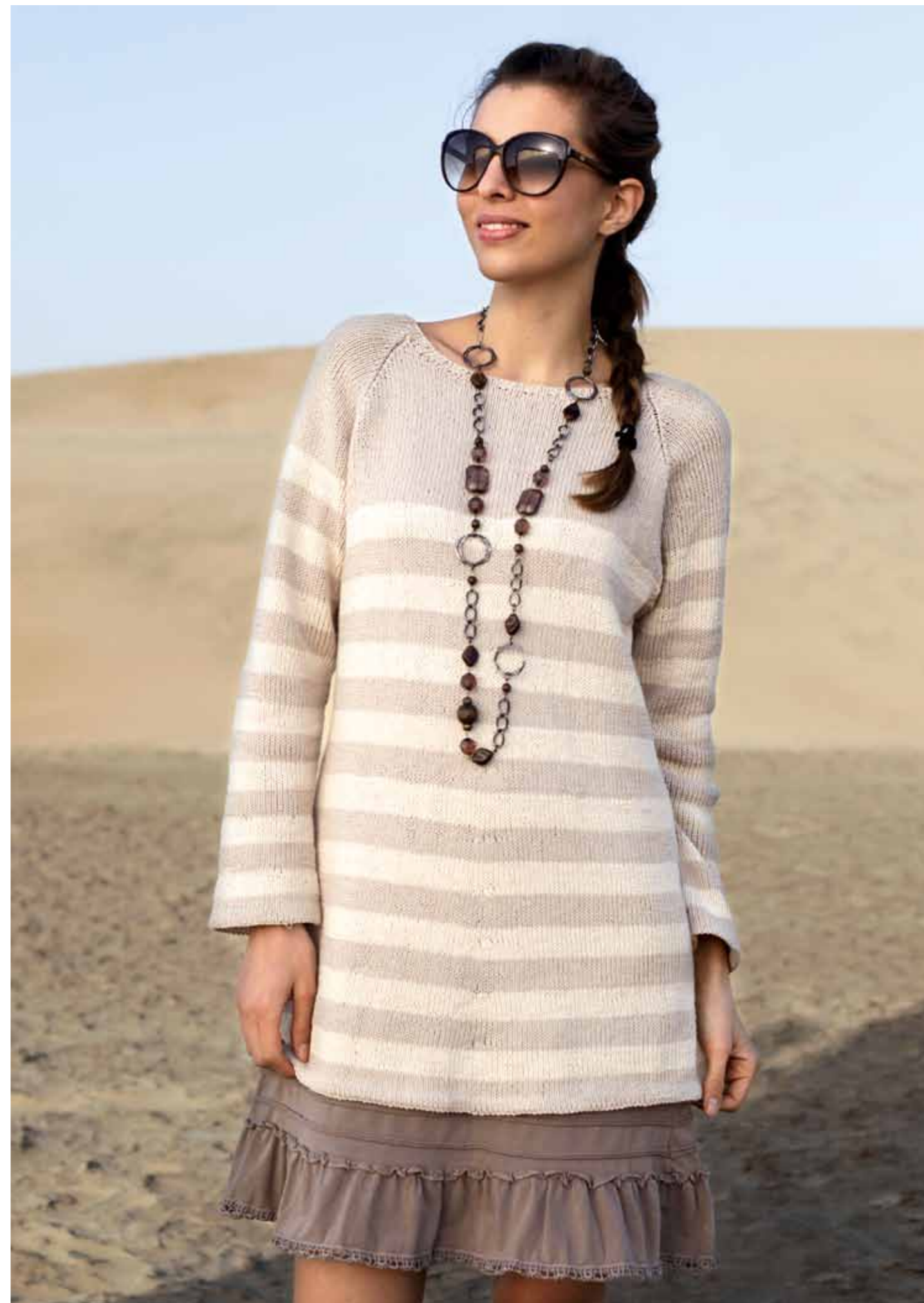
112-1751 Genser i Pt Petunia, XS-XXL