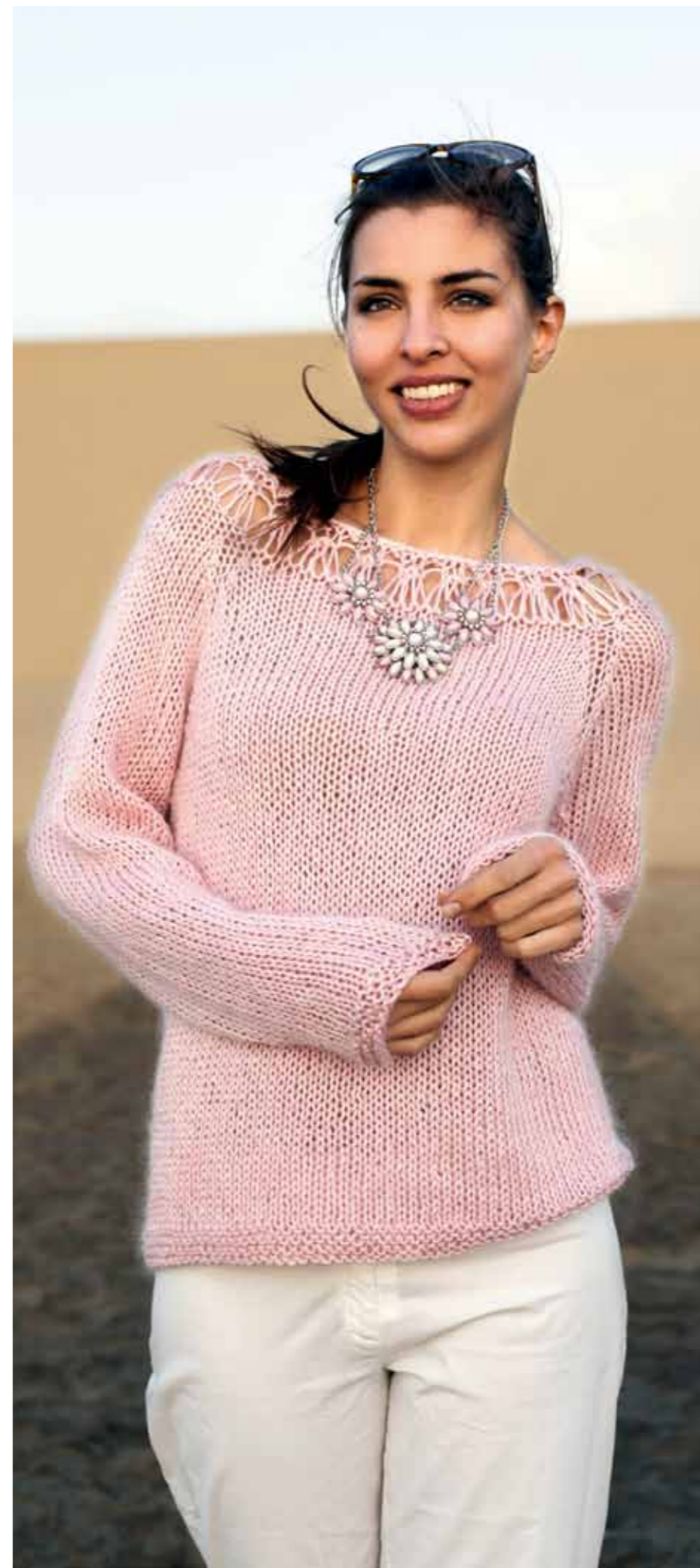
112-1745 Genser i Pt Sumatra og Plum, XS-XXL