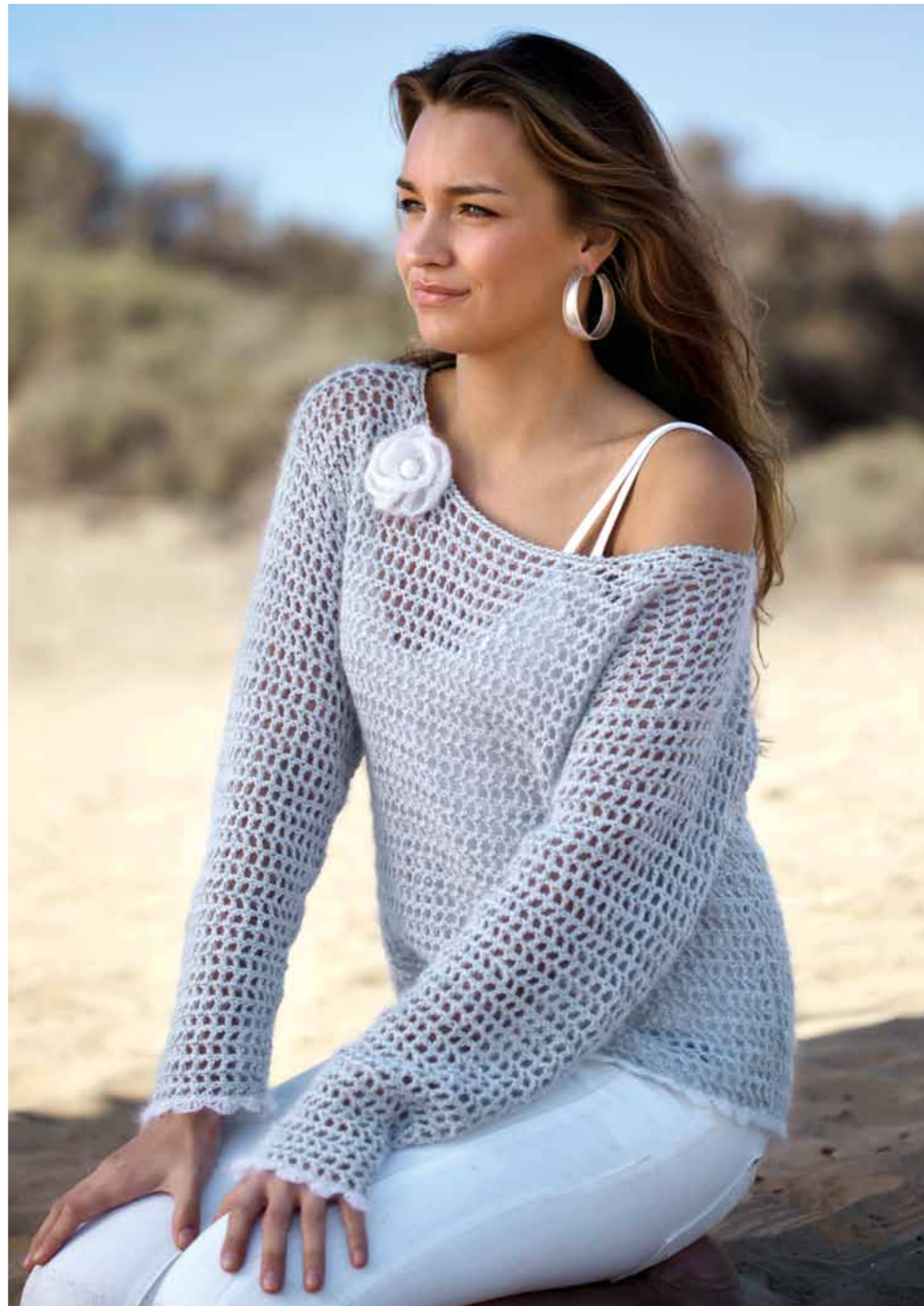
112-1757 Genser i Pt Pandora og Plum (Mod B), XS-XXL