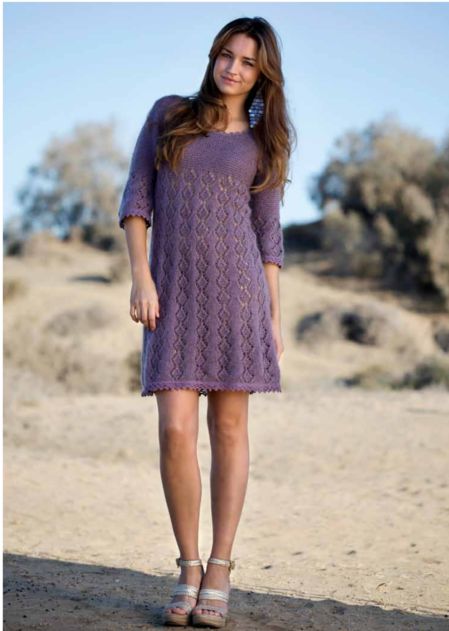
112-1753 Kjole i Pt Pandora og Plum, XS-XXL