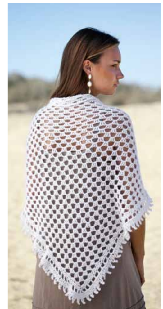
112-1761 Heklet Sjal i Pt Pandora og Plum