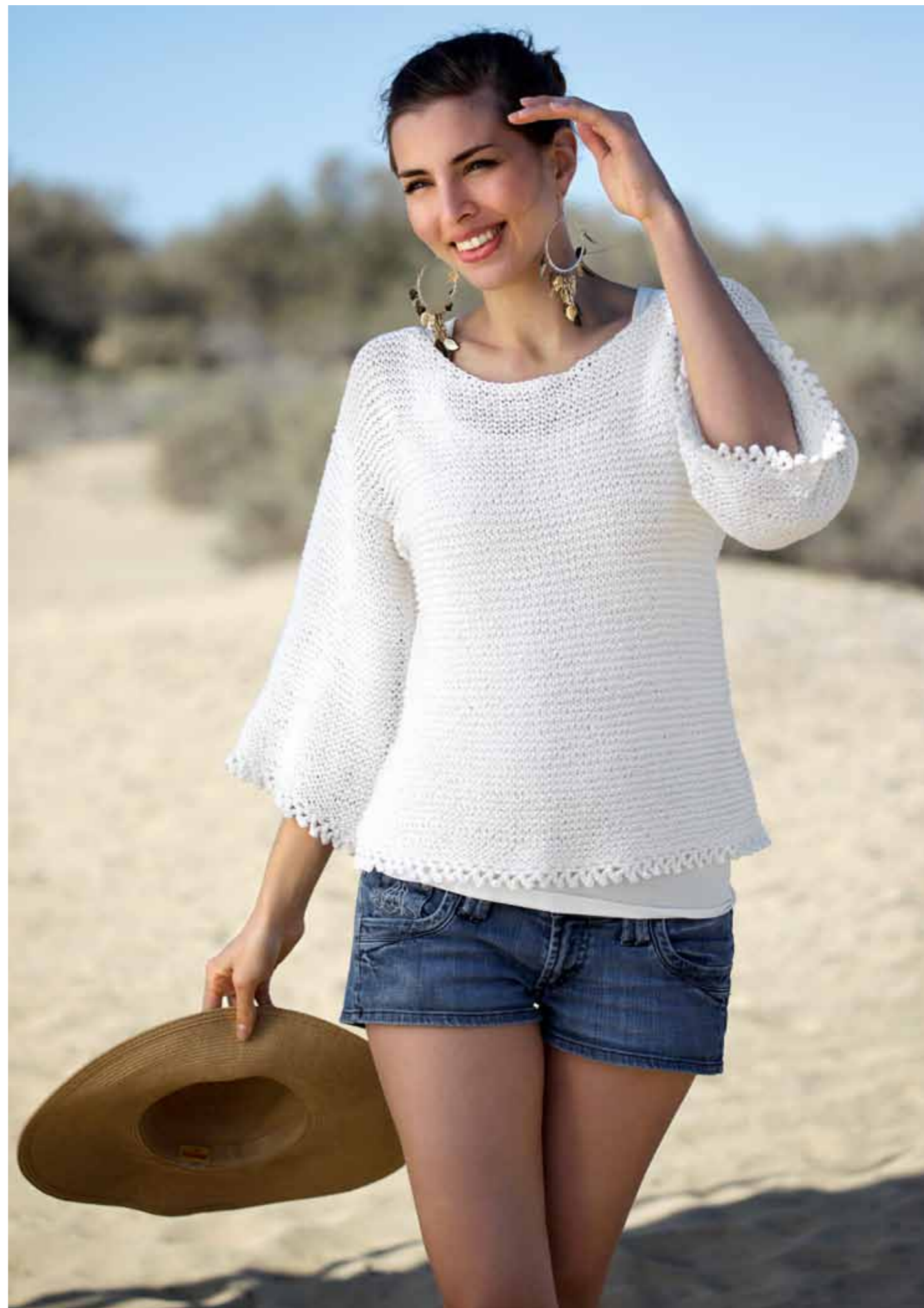
112-1748 Genser i Pt Sumatra (Mod A), XS-XXL