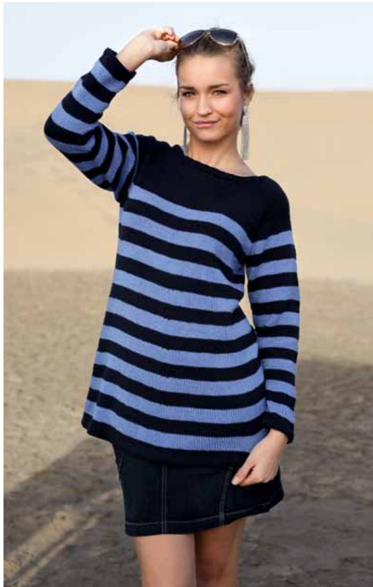
112-1751 Genser i Pt Petunia, XS-XXL