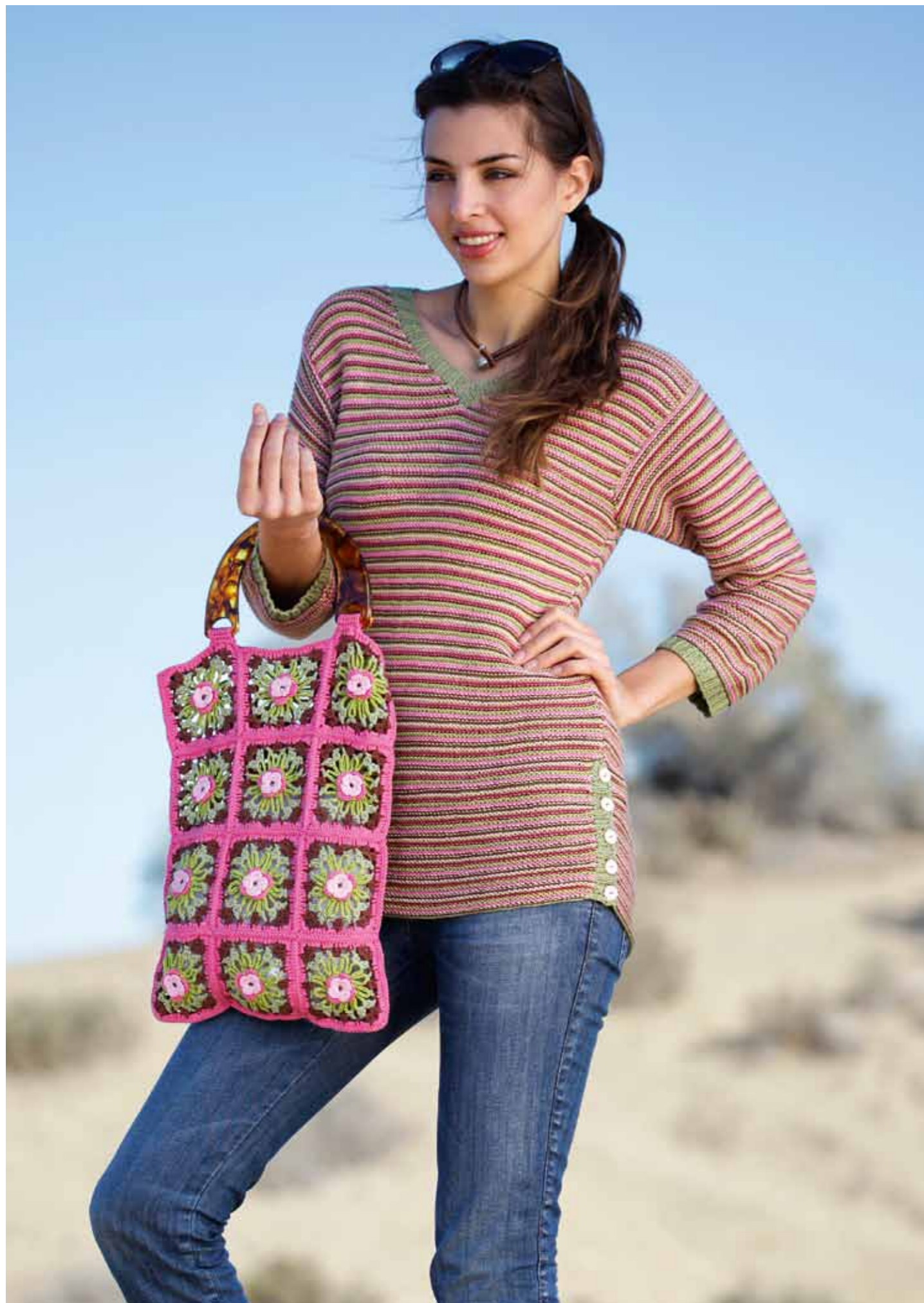
112-1755 Genser i Pt Pandora (Mod B), XS-XXL 112-1756 Heklet nett i Pt Pandora