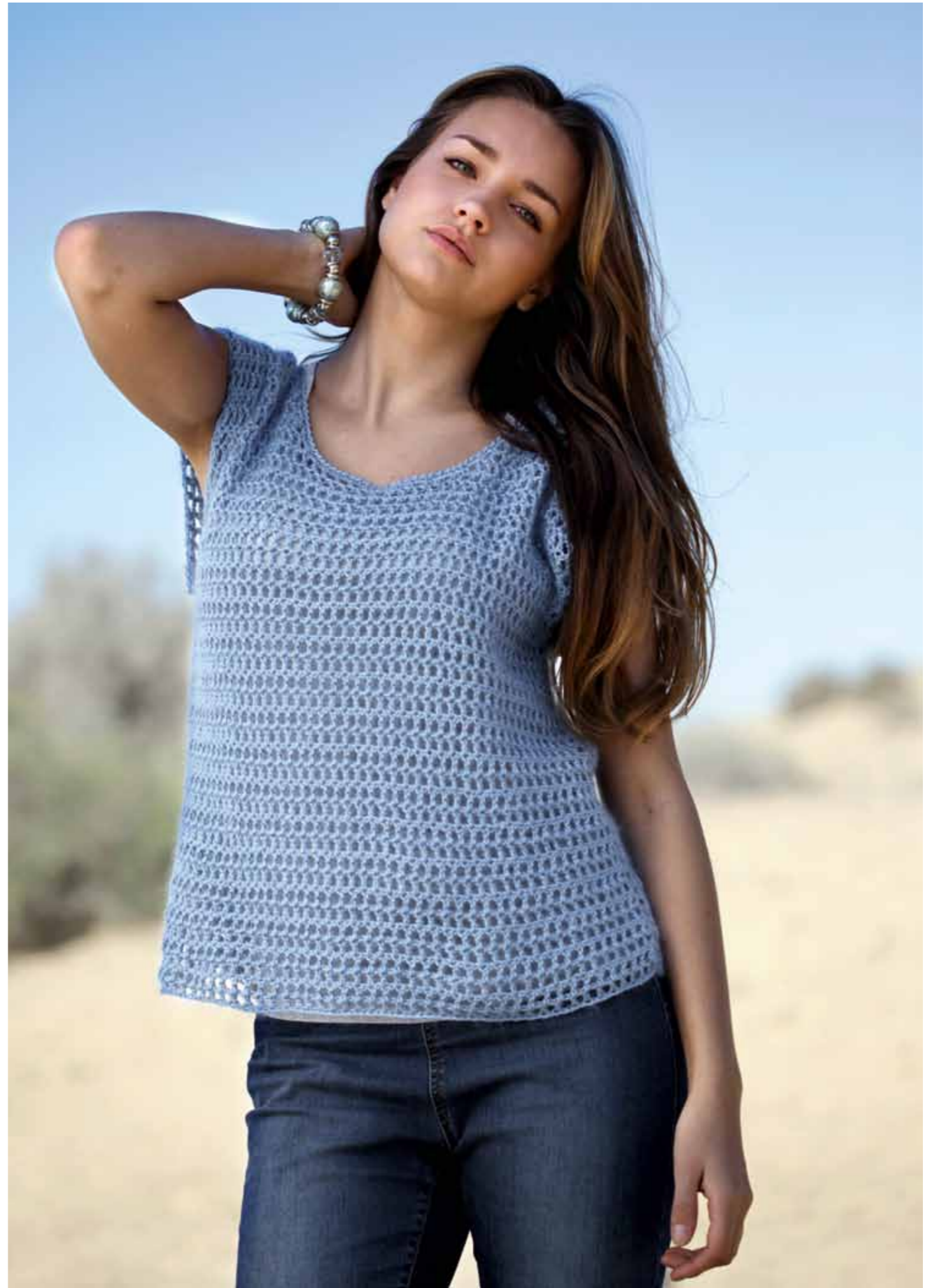
112-1757 Vest i Pt Pandora og Plum (Mod A), XS-XXL