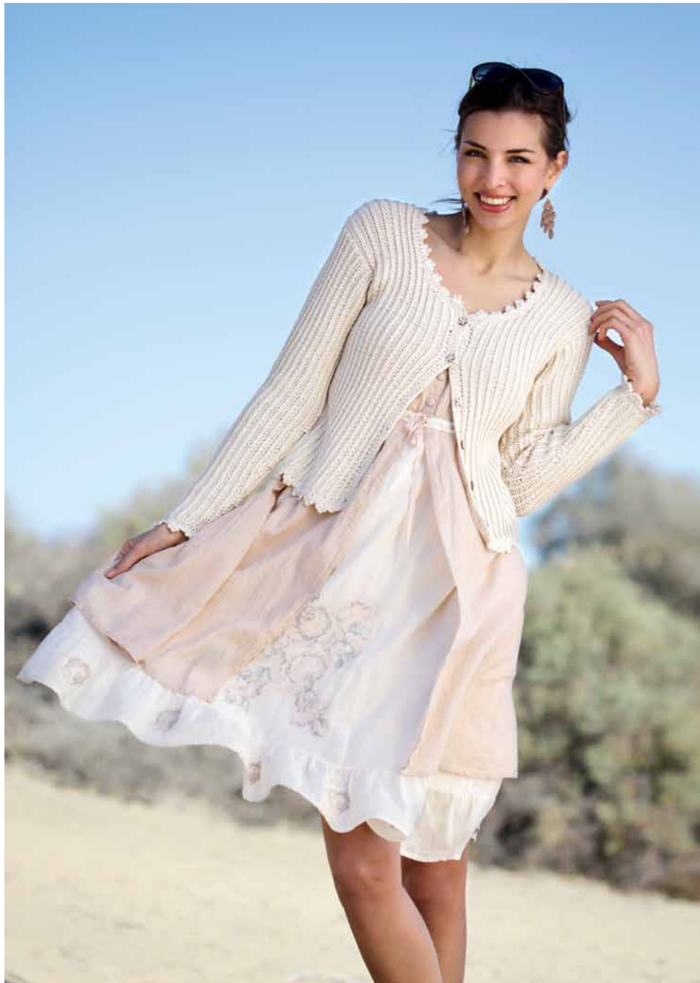
112-1759 Jakke i Pt Petunia, XS-XXL