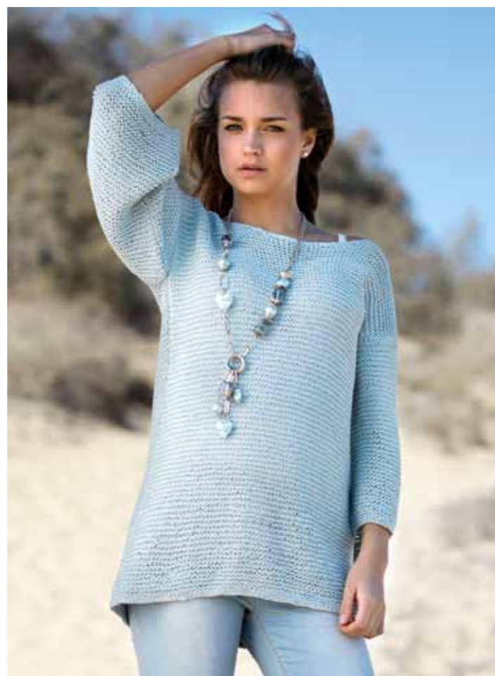
112-1748 Genser i Pt Sumatra (Mod B), XS-XXL