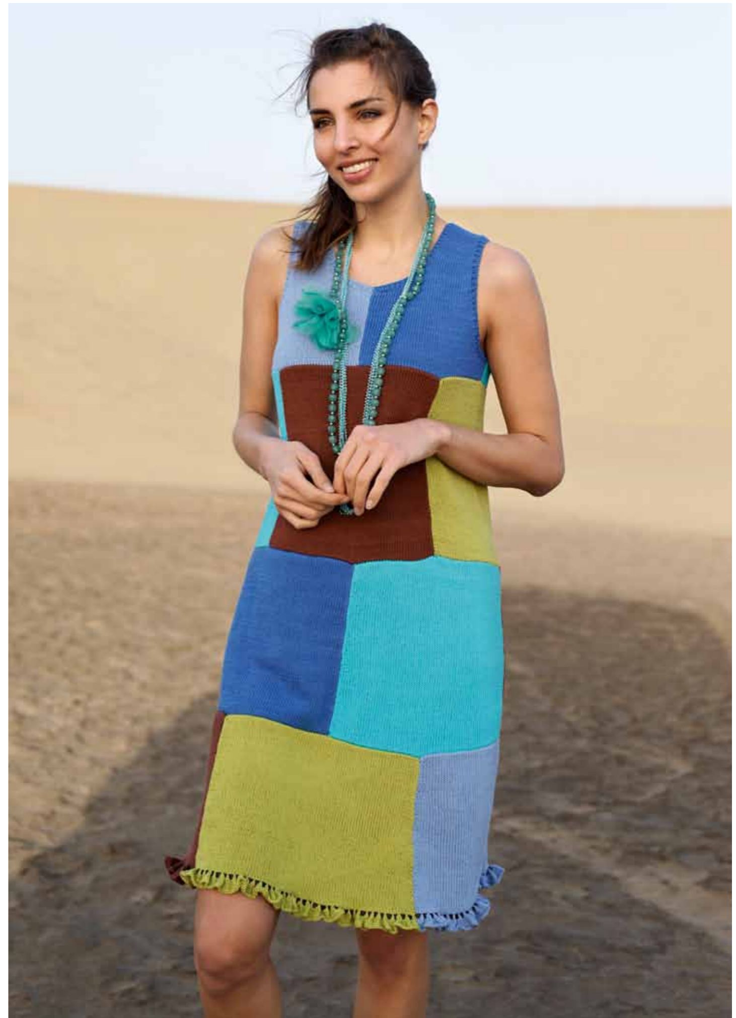
112-1754 Kjole i Pt Pandora, XS-XXL