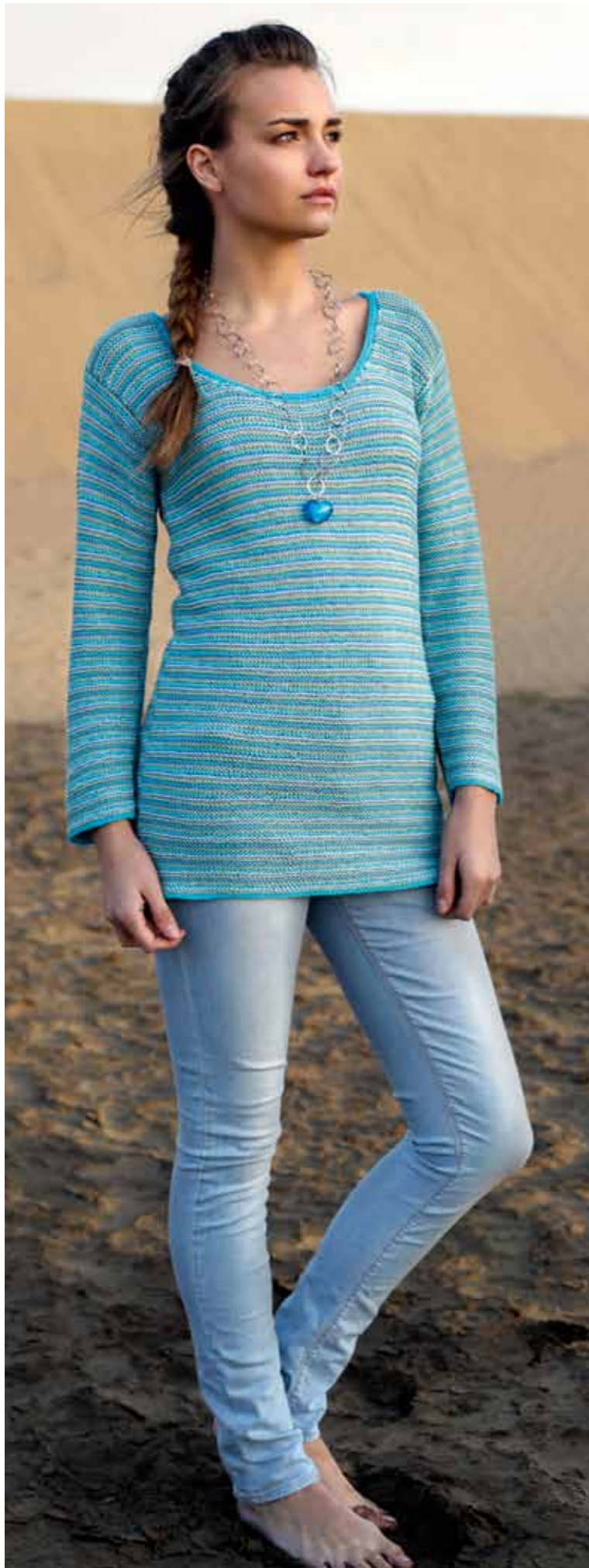
112-1755 Genser i Pt Pandora (Mod A), XS-XXL