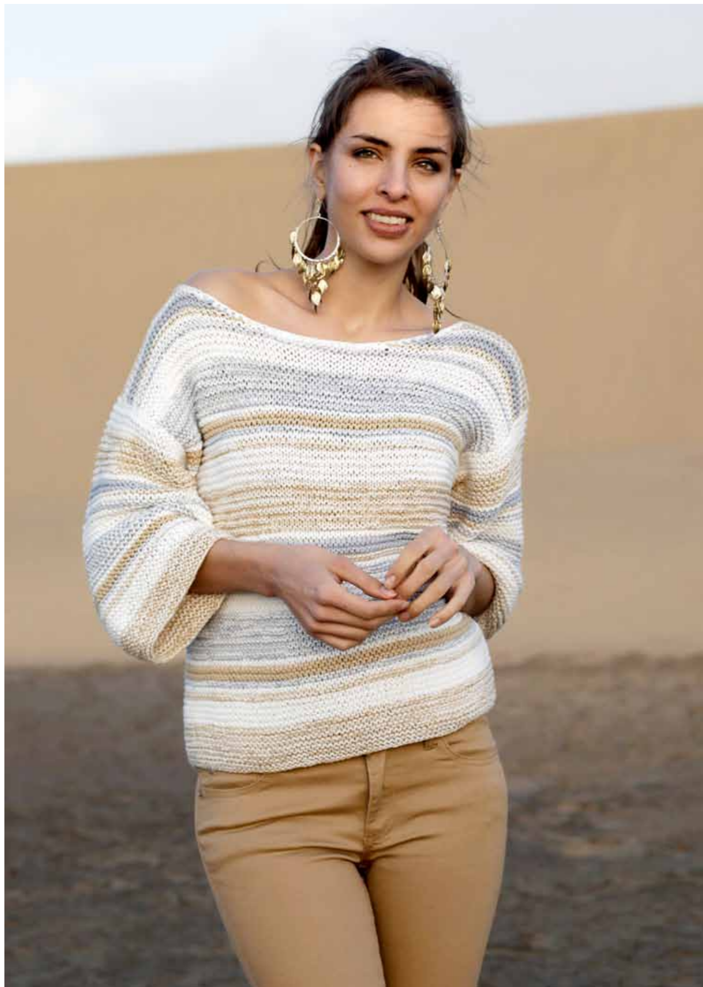
112-1748 Genser i dbl Pt Pandora (Mod C), XS-XXL