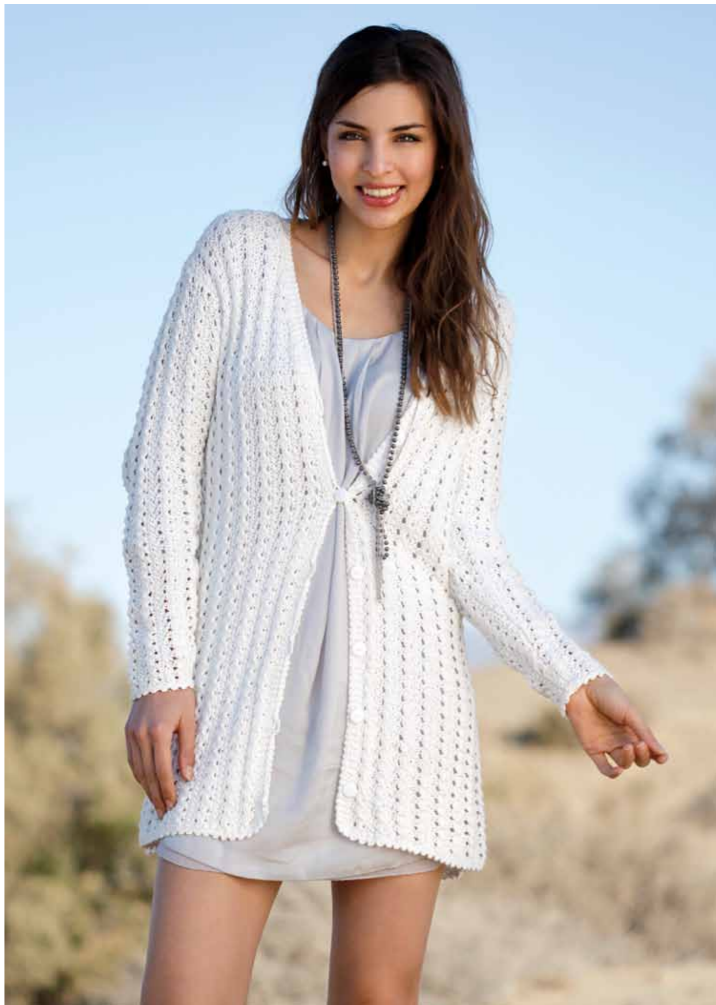
112-1744 Jakke i Pt Petunia, XS-XXL