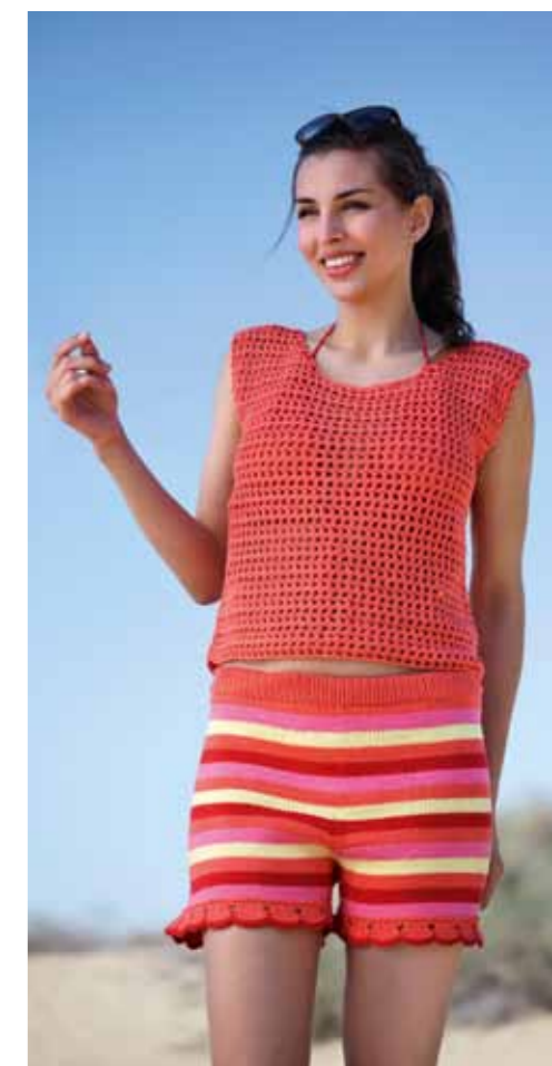
112-1757 Vest i Pt Petunia (Mod C), XS-XXL