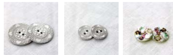
Perlemorsknapper - med hvitt trykk og gravering