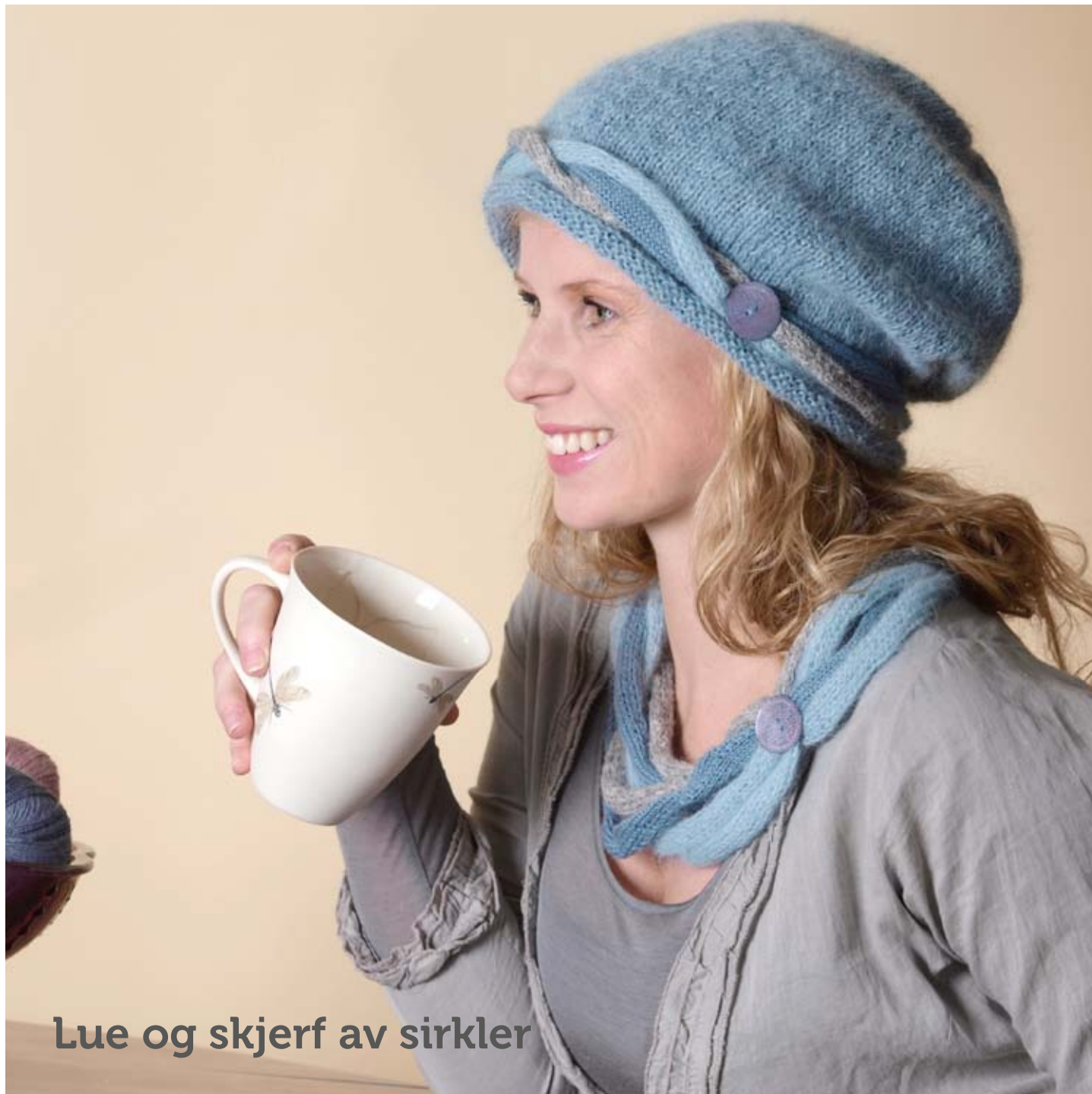
Lue og skjerf av sirkler