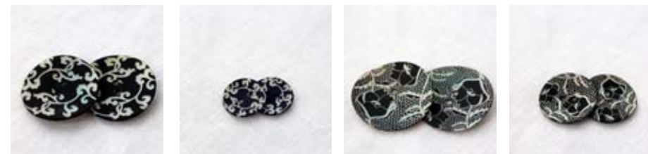
Perlemorsknapper - med sort trykk og gravering