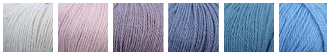
DL 301 DL 306 DL 305 DL 304 DL 302 DL 303

SKY - vakker silkeglans. 70% babyalpukka og 30% silke.