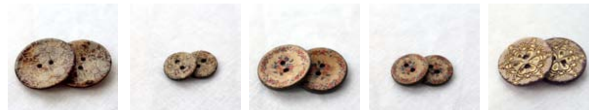
Kokosknapper - med trykk, glitter og preg.