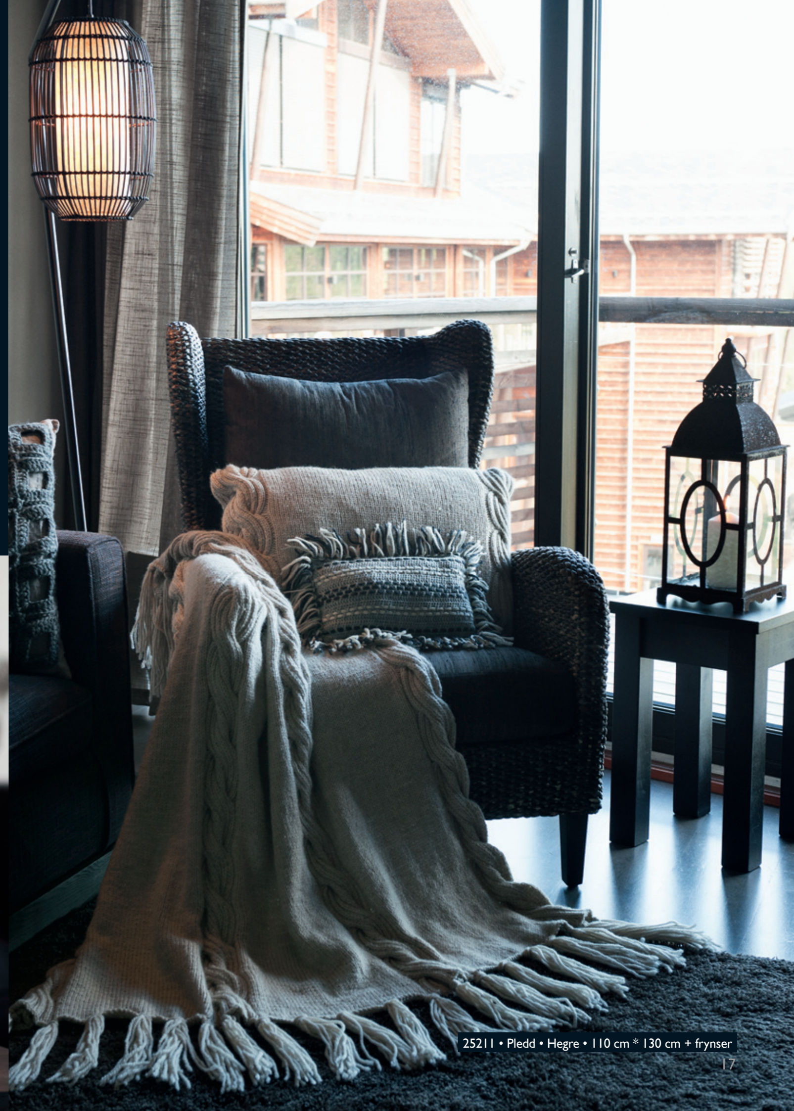
25211 • Pledd • Hegre • 110 cm * 130 cm + frynser

Jeg tenkte at det var fint om teppet kunne bli like fint på begge sider, dermed ble ribbefletten skapt! Teppet og ribbefletteputen er strikket i Hegre.