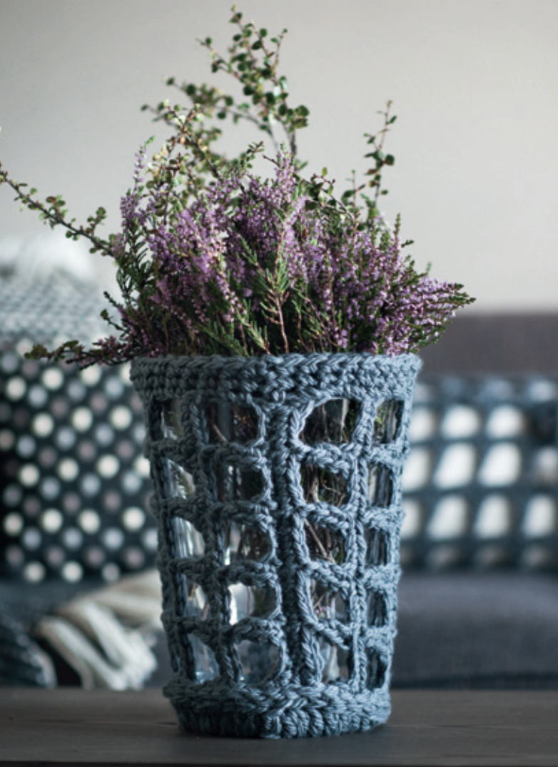
25210 • vase • Hubro