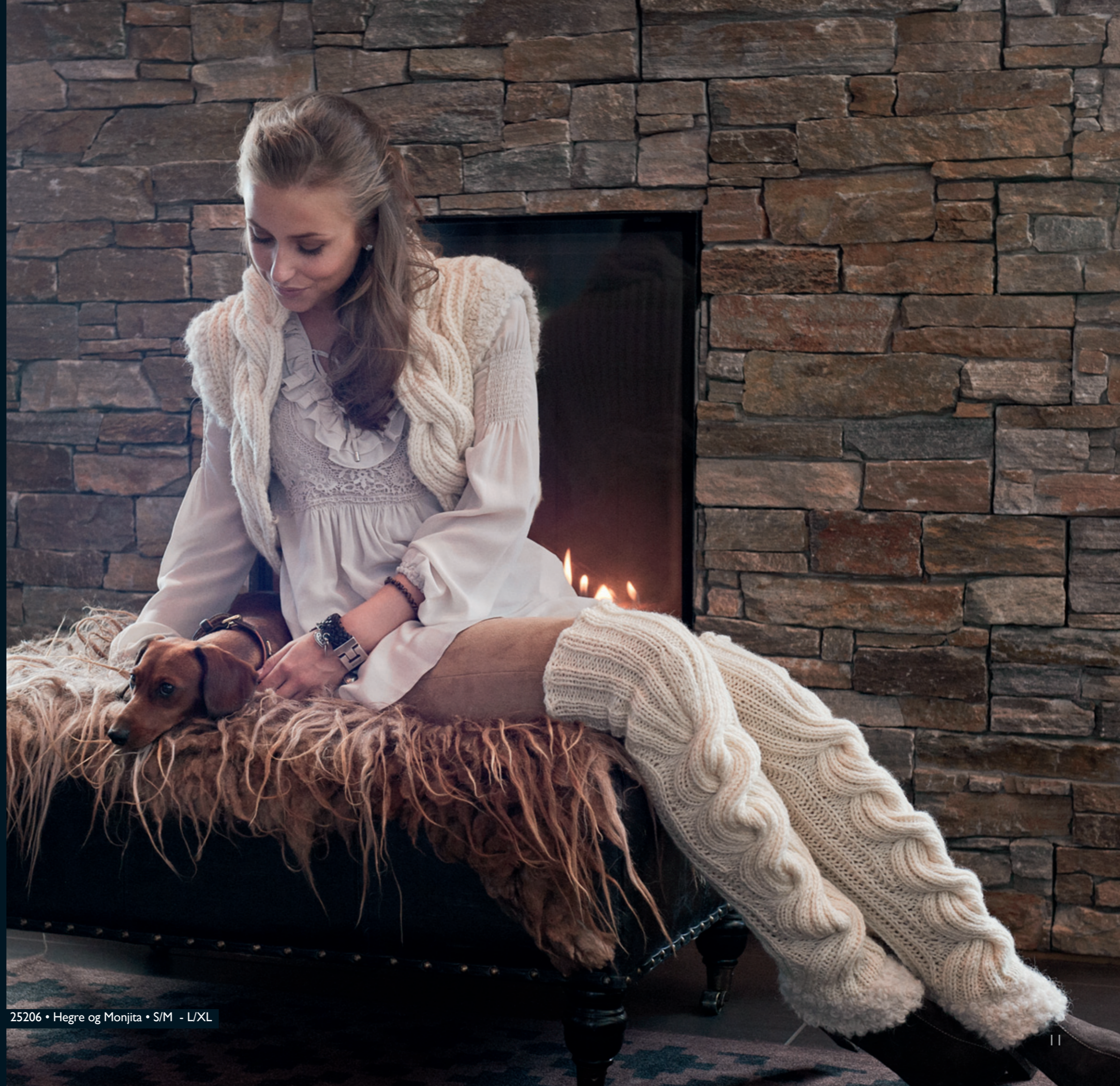
25206 • Hegre og Monjita • S/M - L/XL