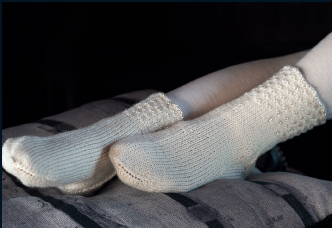
25212 • Falk • One size

Luen, skjerfet, pulsvantene og sokkene er strikkes i Falk. Tre på 4 mm rocaille-perler med sølvfolie inni, de glitrer vakkert. Tips! Dette er veldig hyggelige gaver å få.