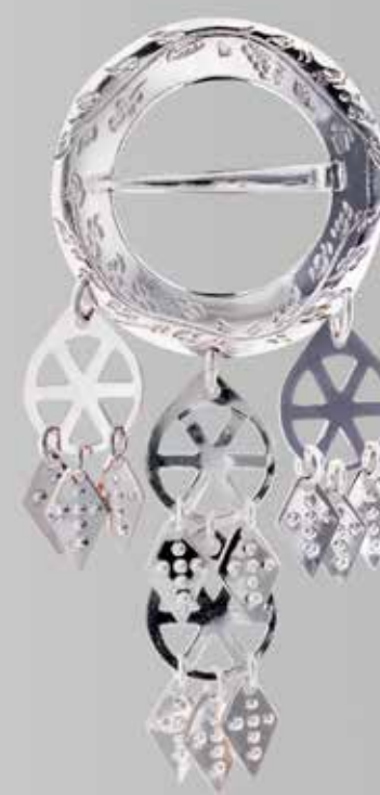
Trøndersølje, middels. Gravert. Hvit og oksidert. Fra Møller. Nr. 4