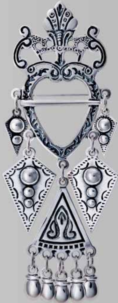
Hjertesølje/kronesølje, støpt. Fra Juul. Nr. 7