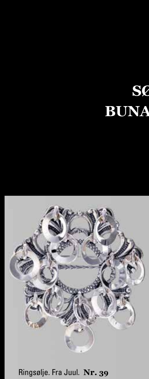
Ringsølje. Fra Juul. Nr. 39