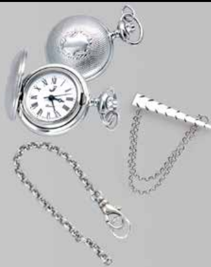
Sjalsnål, lommeur og sikkerhetslenke side 13