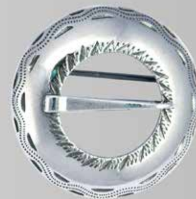
Sølv til bunad – gutt | side 27