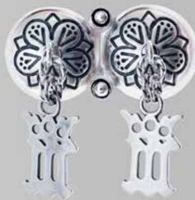
Herresølje med Maria-monogram Fra Juul. Nr. 28