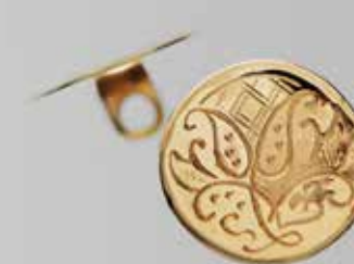
Messingknapper til jakke og nikkers. Stor. Fra Karlgård. Nr. 66