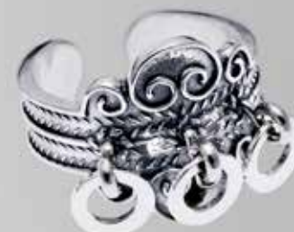
Med ringer. Fra Sylvsmdija. Nr. 21