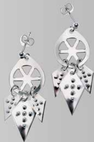
Fra Juul. Nr. 18