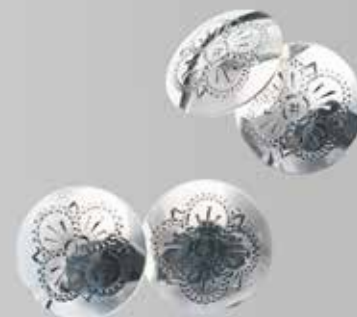
Gravert med trønderrose. Fra Juul. Nr. 22