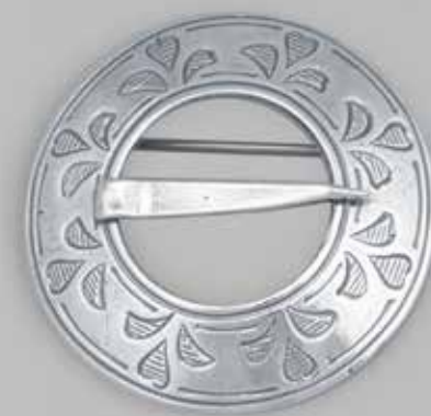
Sølv til Norsk Flid barnebunad | side 29