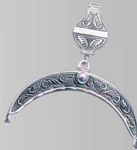
Veskelås | side 15