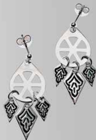
Øredobber | side 12