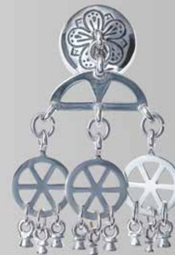
Herreknapp. Fra Juul. Nr. 32