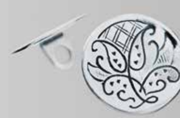
Sølvknapper til jakke og nikkers. Stor. Fra Karlgård. Nr. 64