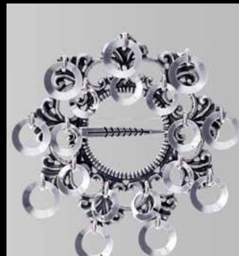
Ringsølje. Fra Møller. Nr. 10