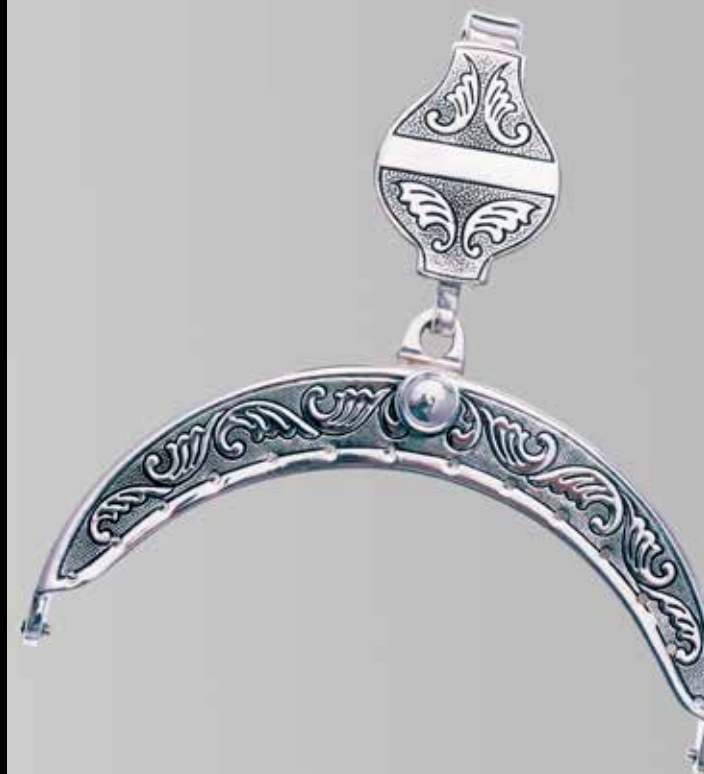
Veskelås, for sølvvet. Finnes også i messing. Nr. 27

Vask smykkene etter bruk og puss dem regelmessig. Dersom smykkene er kraftig anløpet, kan gullsmeden hjelpe deg så den gamle glansen kommer tilbake.