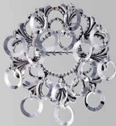
Ringsøljer | side 10