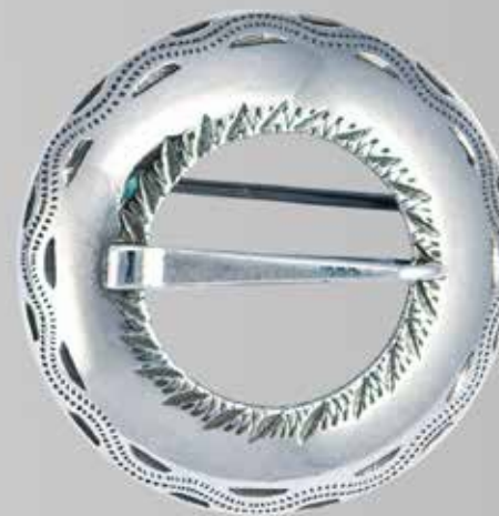
Skjortesølje. Fra Sylvsmidja. Nr. 48