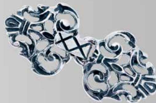
Hekte til cape. Fra Juul. Nr. 26