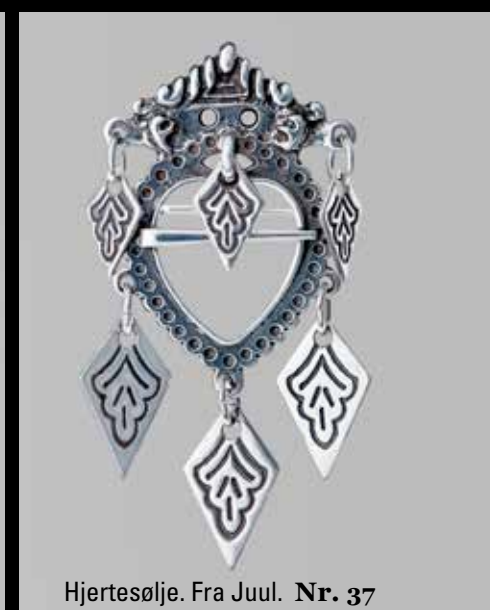
Hjertesølje. Fra Juul. Nr. 37