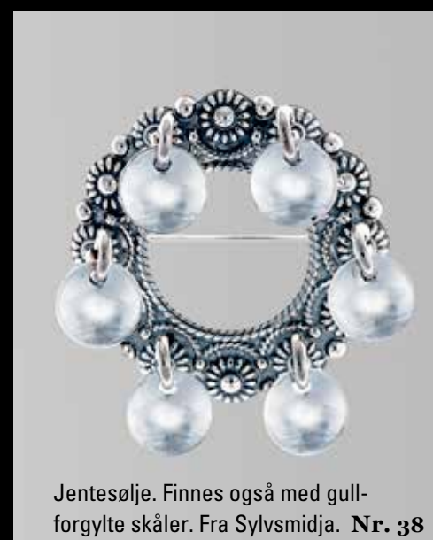
Jentesølje. Finnes også med gull- forgylte skåler. Fra Sylvsmidja. Nr. 38