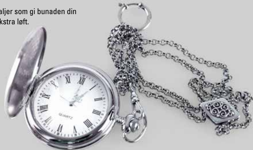
Lommeur i krom. Fra Sylvsmidja. Nr. 30 Lommeur i sølv. Fra Sylvsmidja. Nr. 54

Detaljer som gi bunaden din et ekstra løft.