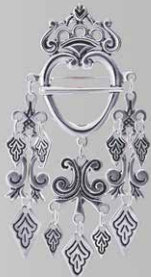
Hjertesøljer | side 8