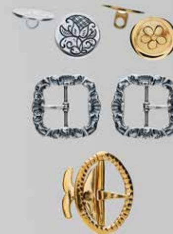
Knespenner og knapper – herre side 23