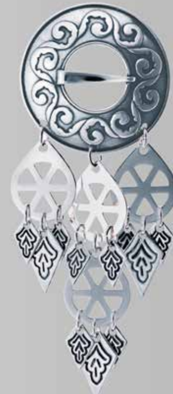
Trøndersølje, middels. Støpt. Fra Juul. Nr. 2