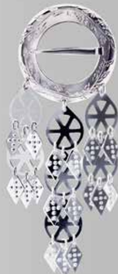
Trøndersøljer | side 9