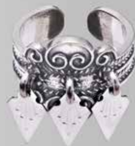
Med løv. Fra Sylvsmdija. Nr. 20