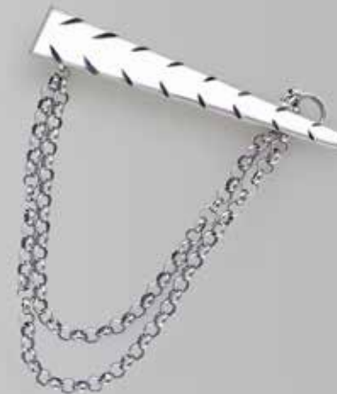
Sjalsnål. Fra Juul. Nr. 45