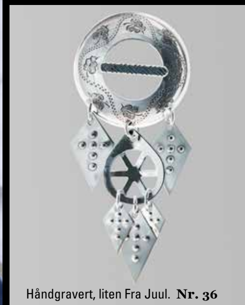
Håndgravert, liten Fra Juul. Nr. 36