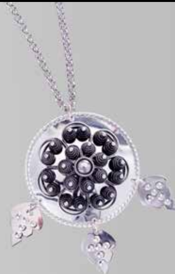
Agnus Dei søljer | side 10