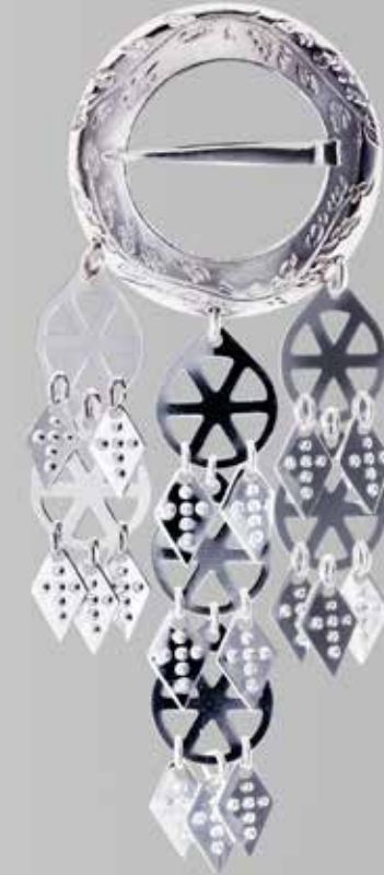
Trøndersølje, stor. Gravert. Museumskopi. Bursølje 1850. Hvit og oksidert. Fra Møller. Nr. 3