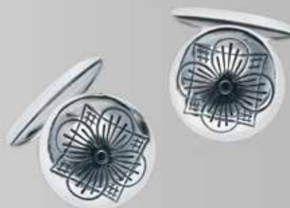
Herre mansjettknapper. Fra Sylvsmidja. Nr.33