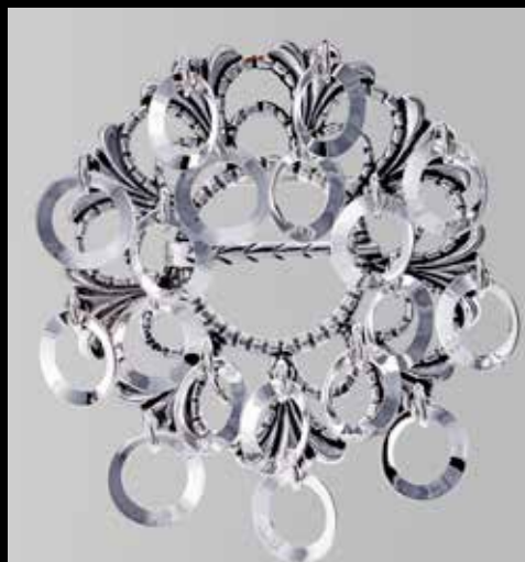
Ringsølje, mye håndarbeid. Fra Juul. Nr. 9