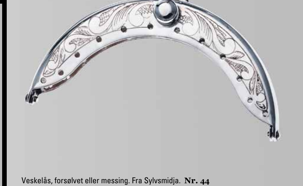
Veskelås, forsølvet eller messing. Fra Sylvsmidja. Nr. 44