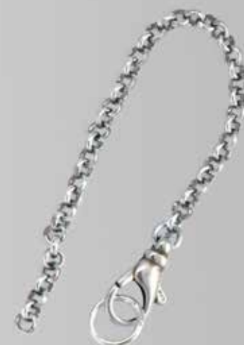
Sikkerhetslenke veske. Fra Sylvsmdija. Nr. 47