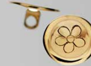
Messingknapper til vest. Liten. Fra Karlgård. Nr. 65