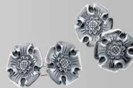
Trønderrose. Fra Juul. Nr. 23