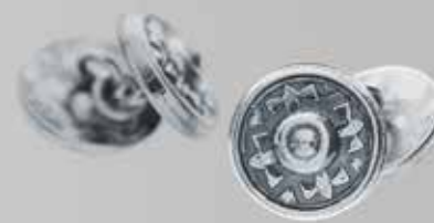
Mansjettknapper – herre | side 21