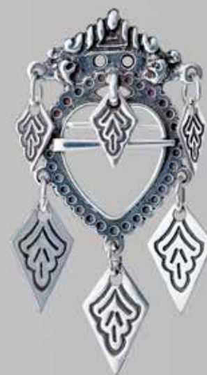
Sølv til bunad – jente | side 24 og 25