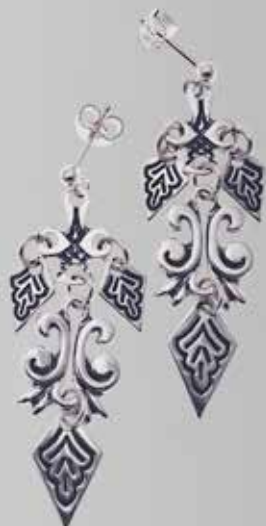
Lang øredobb. Fra Juul. Nr. 16