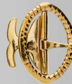
Knespenne i messing. Fra Karlgård. Nr. 69