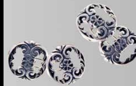
Støpt og gjennombrutt. Fra Juul. Nr. 24