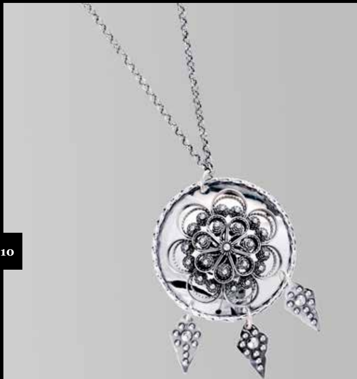
Agnus Dei m/kjede. Fra Sylvsmidja. Nr. 11

Agnus Dei betyr Guds lam på latin, og motivet på denne vakre søljen til trønderbunaden har en rik symbolikk og en spesiell historie. Tradisjonen tro bæres smykket rundt halsen, nært hjertet som et kristent vernesymbol.