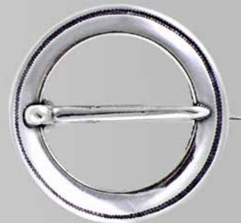
Skjortesølje, stor. Fra Sylvsmidja. Nr. 49