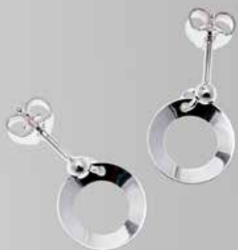
Enkel. Fra Sylvsmdija. Nr. 19