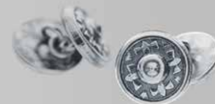
Herre mansjettknapper. Fra Møller. Nr. 55