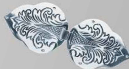
Hekter til vest og cape | side 15