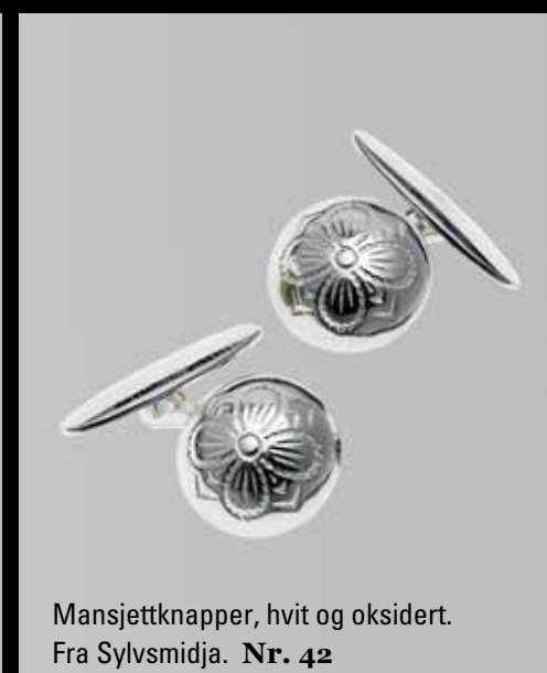
Mansjettknapper, hvit og oksidert. Fra Sylvsmidja. Nr. 42