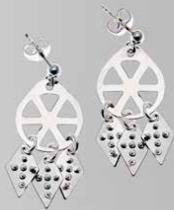
Til gravert trøndersølje, enkel. Fra Møller. Nr. 14