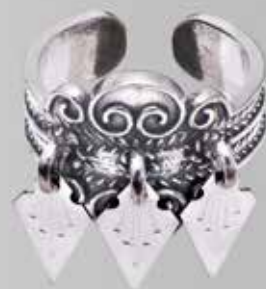
Ringer | side 12–13