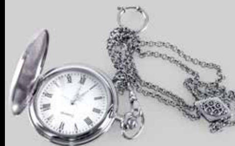
Lommeur med enkel- og dobbel sølvlenke | side 22