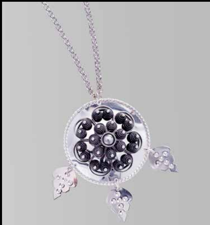
Agnus Dei m/kjede. Mye håndarbeid. Fra Juul. Nr. 12