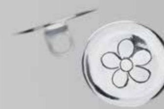
Sølvknapper til vest. Liten. Fra Karlgård. Nr. 63