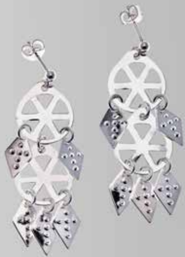
Til gravert trøndersølje, dobbel. Fra Møller. Nr. 13