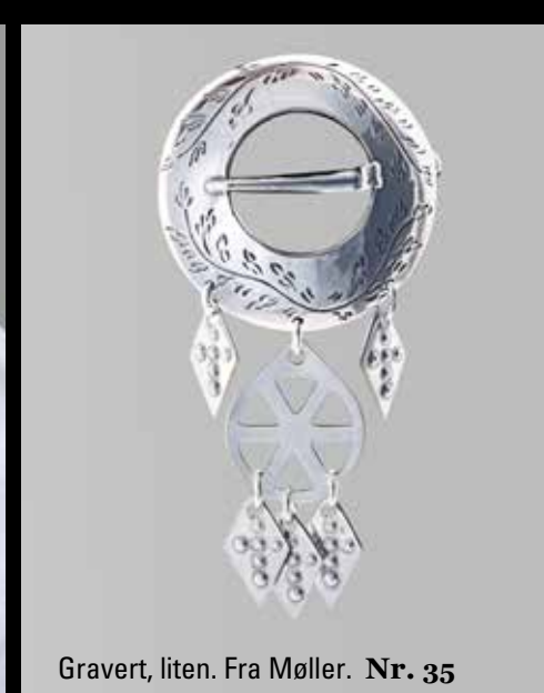
Gravert, liten. Fra Møller. Nr. 35