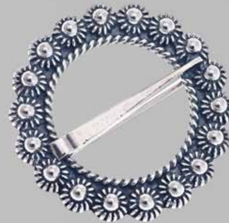
Skjortesølje. Finnes også i liten. Fra Sylvsmidja. Stor Nr. 41 Liten Nr. 71