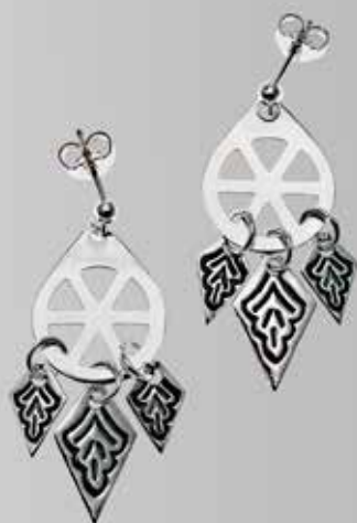
12 Støpt trøndersølje, enkel. Fra Juul. Nr. 15