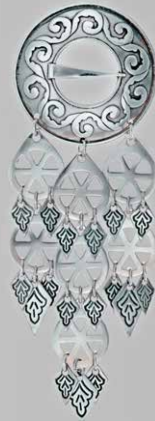
Trøndersølje, stor. Støpt. Fra Juul. Nr. 1