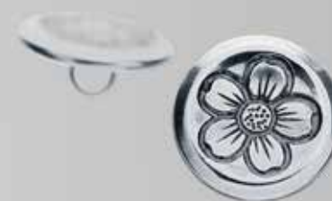
Sølvknapper til vest. Liten. Fra Møller. Finnes også i messing. Liten. Nr. 59