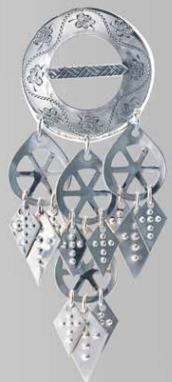
Trøndersølje, middels. Håndgravert. Fra Juul. Nr. 6