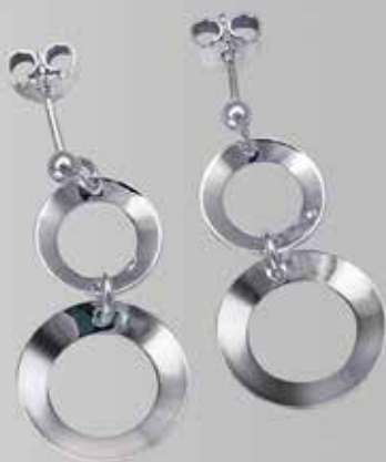
Dobbel. Fra Sylvsmdija. Nr. 19