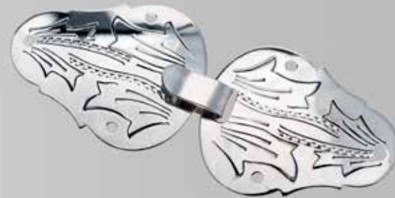
Hekte til vest. Fra Juul. Nr. 25