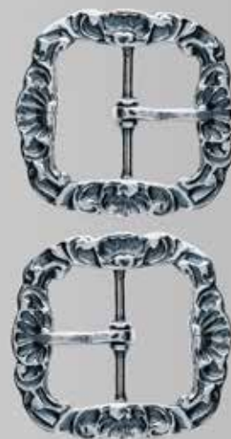
Knespenner i sølv. Fra Møller. Finnes også i messing. Nr. 67