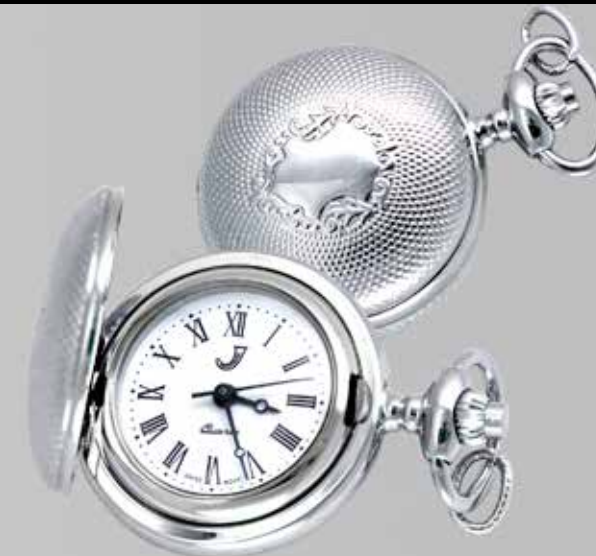
Dameklokke. Fra Sylvsmdija. Nr. 46