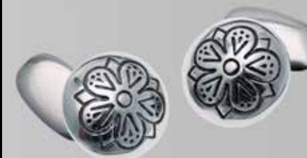
Herre mansjettknapper. Fra Juul. Nr.34