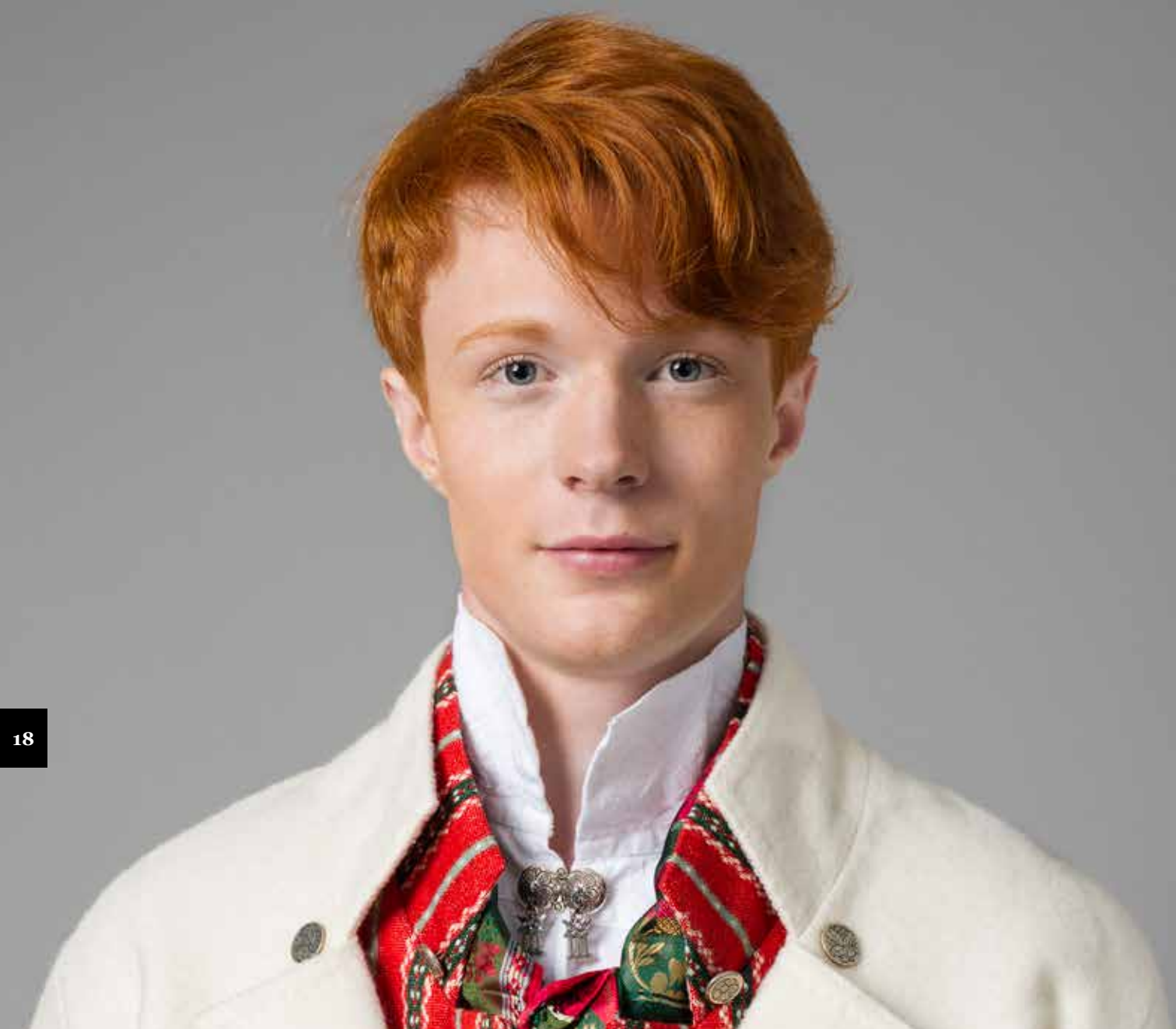
SØLV TIL BORGERBUNADEN SAMT TRØNDER- BUNAD MED RØTTER I GAULDAL OG ÅLEN