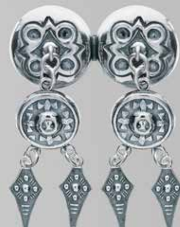
Herresølje. Fra Møller. Nr. 54