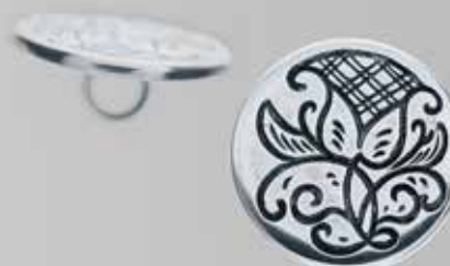
Sølvknapper til jakke og nikkers. Finnes også i messing. Stor. Fra Møller. Nr. 60