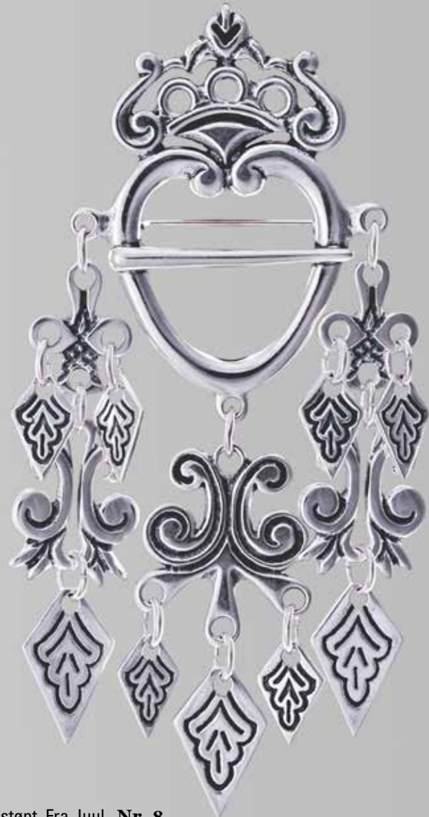
Hjertesølje, støpt. Fra Juul. Nr. 8

«En sølje er et spænde med et rundt Hul i midten, og med en enkelt Torn som fæstet paa den ene Side av Hullet.» (Ivar Aasen)