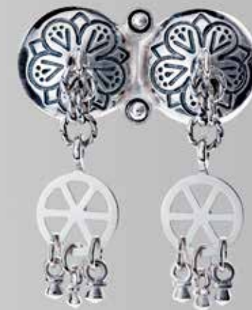
Søljer – herre | side 21