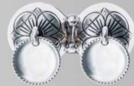
Guttesølje. Fra Sylvsmidja. Nr. 40