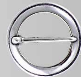
Skjortesølje, liten. Fra Sylvsmidja. Nr. 50