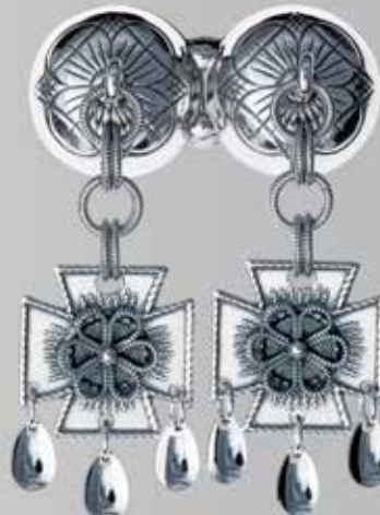
Herresølje. Fra Sylvsmidja. Nr. 31