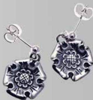
Støpt trønderrose. Finnes også u/heng. Fra Juul. Nr. 17