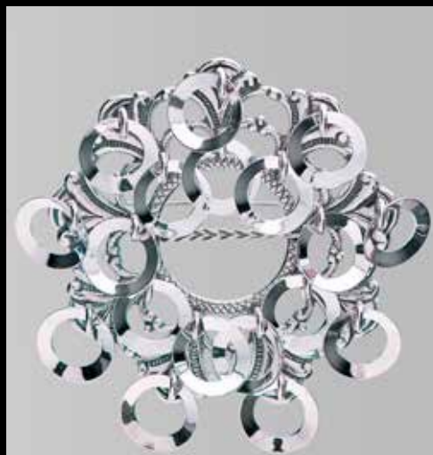
Ringsølje. Fra Sylvsmidja. Nr. 52