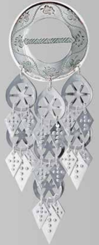
Trøndersølje, stor. Håndgravert. Fra Juul. Nr. 5