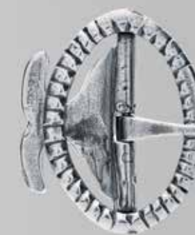
Knespenne i sølv. Fra Karlgård. Nr. 70