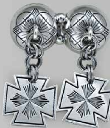
Herresølje. Fra Sylvsmidja. Nr. 48