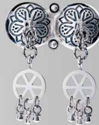
Herresølje med såkorn. Fra Juul. Nr. 29